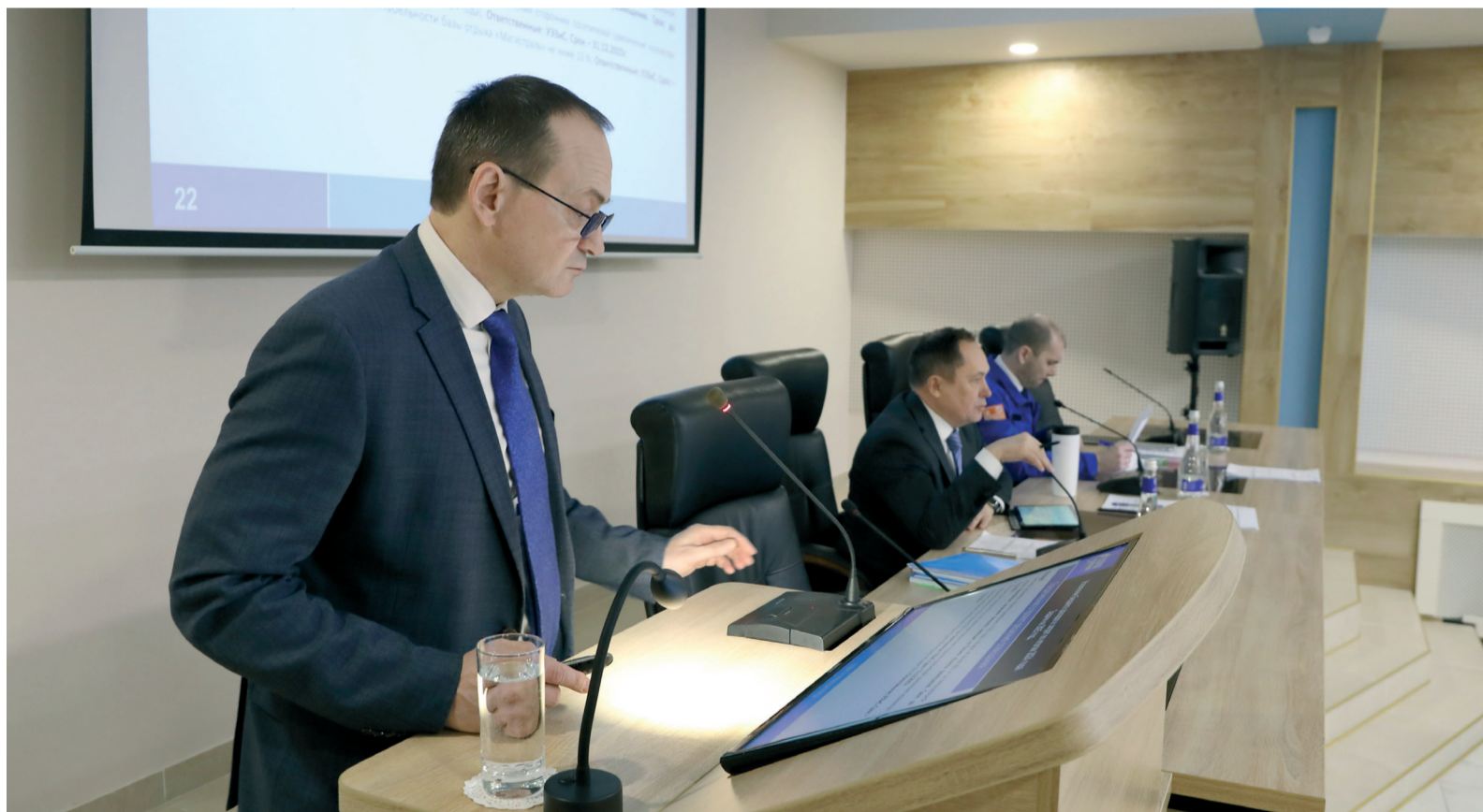
В ходе заседания Совета руководителей участники обсудили широкий круг тем – от производства и цифровизации до актуальных кадровых вопросов

В марте в администрации «Газпром трансгаз Волгоград» состоялось заседание Совета руководителей компании. Начальники филиалов, отделов и служб подвели итоги работы предприятия в 2024 году и обсудили актуальные задачи на текущий год.