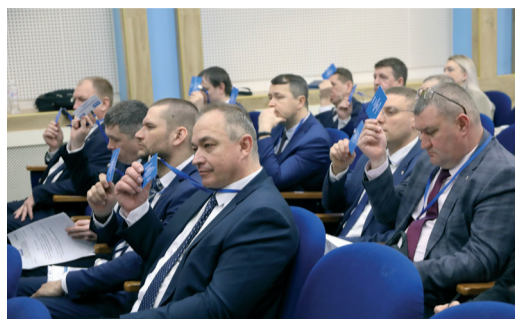
В ОБЩЕСТВЕ ПОДВЕЛИ ИТОГИ ВЫПОЛНЕНИЯ КОЛЛЕКТИВНОГО ДОГОВОРА ЗА 2024 ГОД