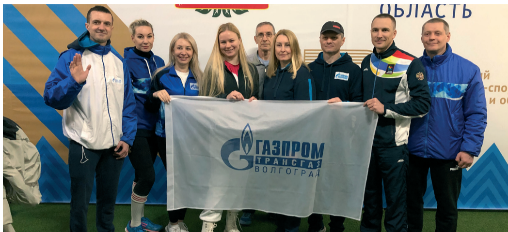
Сборная «Газпром трансгаз Волгоград» на Фестивале ГТО

Сюжет с соревнований смотрите на Rutub канале Общества.