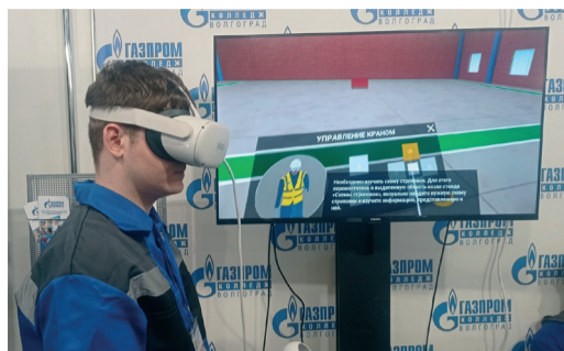
«ГАЗПРОМ ТРАНСГАЗ ВОЛГОГРАД» РЕШАЕТ ЗАДАЧИ ПРОФИОРИЕНТАЦИИ МОЛОДЕЖИ