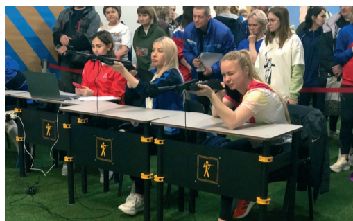
КОМАНДА ОБЩЕСТВА – СЕРЕБРЯНЫЙ ПРИЗЕР РЕГИОНАЛЬНЫХ СОРЕВНОВАНИЙ КОМПЛЕКСА ГТО