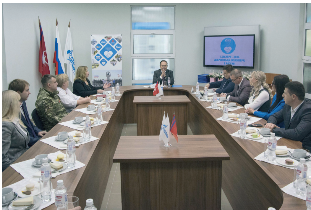
Обсуждение актуальных вопросов за круглым столом

5 декабря, в День добровольца (волонтера) в России, в Центре корпоративной истории «Газпром трансгаз Волгоград» состоялось торжественное награждение наиболее активных волонтеров предприятий Объединения «Газпром в Волгоградской области».