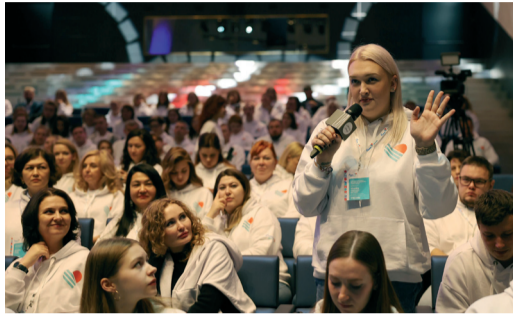
РАБОТНИКИ ОБЩЕСТВА СТАЛИ УЧАСТНИКАМИ I ФОРУМА КОРПОРАТИВНЫХ ДОБРОВОЛЬЦЕВ (ВОЛОНТЕРОВ) ГРУППЫ «ГАЗПРОМ» стр. 2