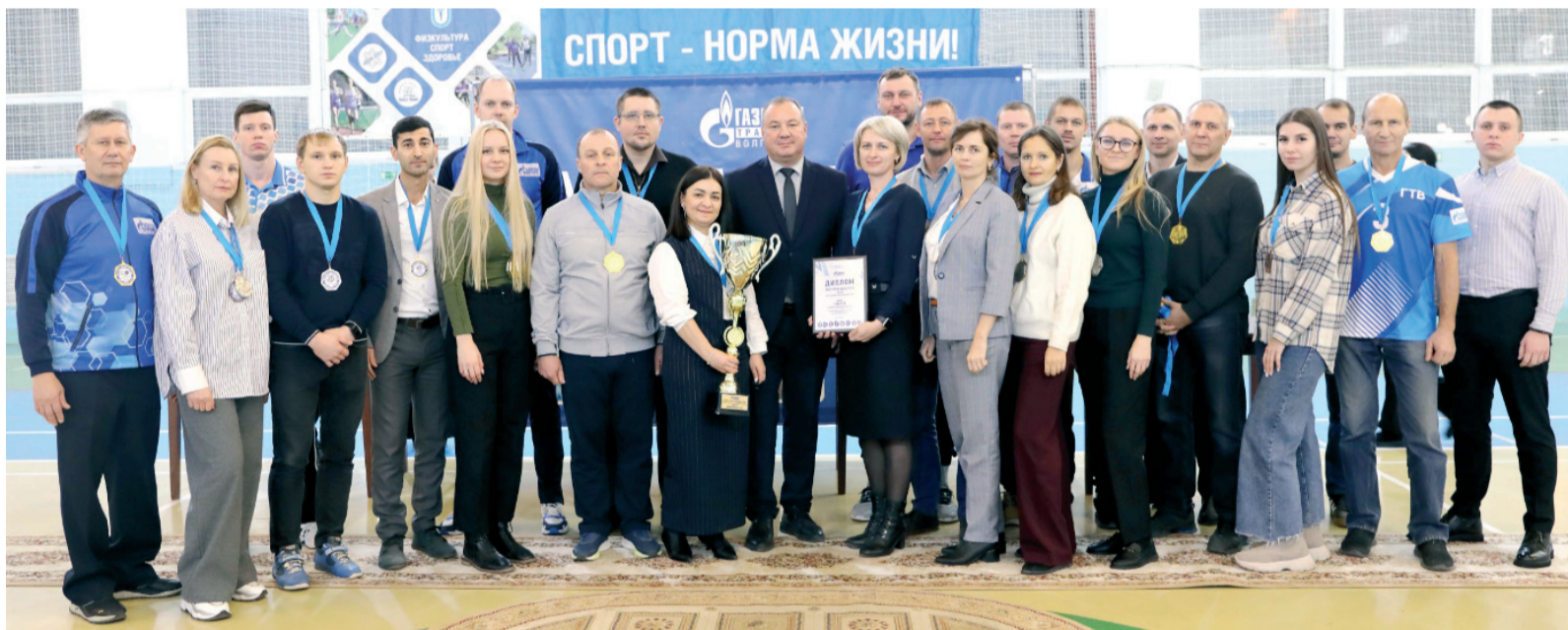
Команда Общества - победитель соревнований «Кубок газовиков-2024»

6 декабря стали известны имена сильнейших команд объединения «Газпром в Волгоградской области», которые приняли участие в турнире «Кубок газовиков-2024». Сотрудники газовых компаний сразились в соревнованиях по мини-футболу, волейболу, баскетболу, настольному теннису, быстрым шахматам, плаванию, стрельбе и многоборью ГТО.