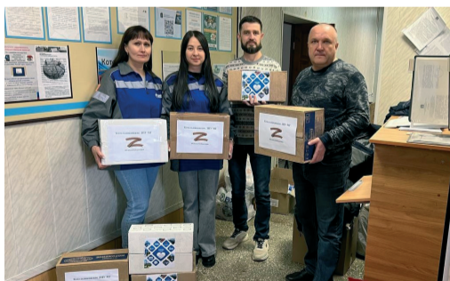
Работники «Газпром трансгаз Волгоград» собирают новогодние посылки для бойцов

Так, в сентябре этого года газовики купили и передали бойцам одной из воинских частей, находящейся в ЛНР, электрогенератор. В ок-