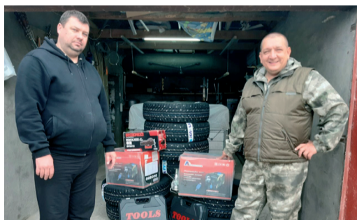
На средства Фонда закуплено и передано необходимое оборудование

Компания «Газпром трансгаз Волгоград» продолжает проводить большую патриотическую деятельность. Особенно ярко она проявляется в поддержке бойцов, которые находятся на линии боевого соприкосновения в зоне проведения специальной военной операции.