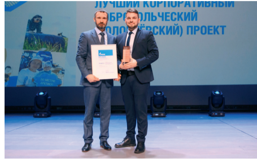
ПРОЕКТЫ ОБЩЕСТВА - ПРИЗЕРЫ КОНКУРСА СЛУЖБ ПО СВЯЗЯМ С ОБЩЕСТВЕННОСТЬЮ И СМИ ДОЧЕРНИХ ОБЩЕСТВ ПАО «ГАЗПРОМ» стр. 4