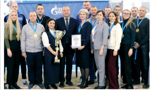
КОМАНДА «ГАЗПРОМ ТРАНСГАЗ ВОЛГОГРАД» - ПОБЕДИТЕЛЬ СОРЕВНОВАНИЙ «КУБОК ГАЗОВИКОВ-2024» стр. 4

ПОДПИШИТЕСЬ НА ОФИЦИАЛЬНЫЕ ИНФОРМАЦИОННЫЕ РЕСУРСЫ