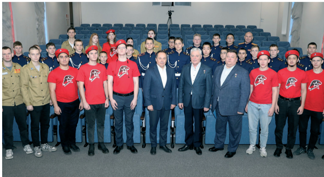
Участники патриотического мероприятия «Диалоги с Героями»