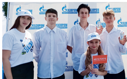
КОМПАНИЯ «ГАЗПРОМ ТРАНСГАЗ ВОЛГОГРАД» ПРИНЯЛА УЧАСТИЕ В ЕЖЕГОДНОМ ФЕСТИВАЛЕ ЭНЕРГОСБЕРЕЖЕНИЯ И ЭКОЛОГИИ #ВМЕСТЕЯРЧЕ стр. 4