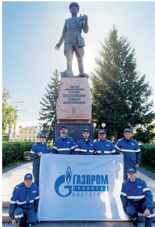
Команда Общества в Томске

С 16 по 20 сентября состоялся третий Фестиваль труда ПАО «Газпром». Конкурсные мероприятия прошли в нескольких городах России.