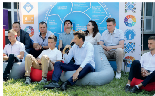
В «ГАЗПРОМ ТРАНСГАЗ ВОЛГОГРАД» СОСТОЯЛСЯ ОТКРЫТЫЙ ДИАЛОГ МОЛОДЫХ РАБОТНИКОВ С РУКОВОДСТВОМ КОМПАНИИ стр. 3