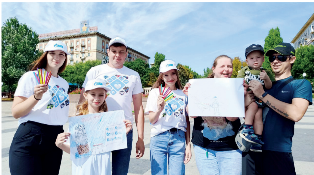
Экологический фестиваль стал семейным праздником

В первый день осени на центральной набережной Волгограда состоялся Всероссийский фестиваль #ВместеЯрче, на котором предприятия топливно-энергетического комплекса познакомили жителей города с безопасным и экономичным использованием энергоресурсов.