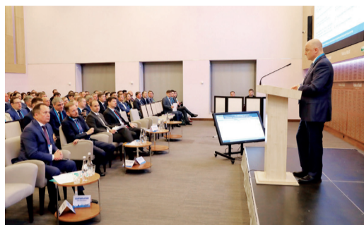
В ВОЛГОГРАДЕ ПРОШЛО ТРЕТЬЕ ОТРАСЛЕВОЕ СОВЕЩАНИЕ РУКОВОДИТЕЛЕЙ СЛУЖБ ИТ И АСУ ТП ГРУППЫ ГАЗПРОМ стр. 2