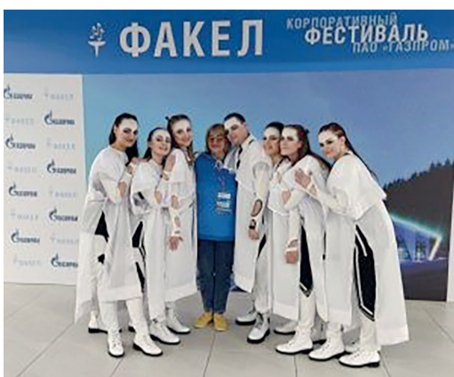
Ансамбль VIVA CANTU

Скоро-скоро одно из самых ожидаемых событий осени — старт зональных туров яркого корпоративного фестиваля-конкурса «Факел».