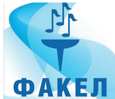
ДЕЛЕГАЦИЯ «ГАЗПРОМ ТРАНСГАЗ ВОЛГОГРАД» ГОТОВИТСЯ К УЧАСТИЮ В ЗОНАЛЬНОМ ТУРЕ КОРПОРАТИВНОГО ФЕСТИВАЛЯ «ФАКЕЛ» стр. 4