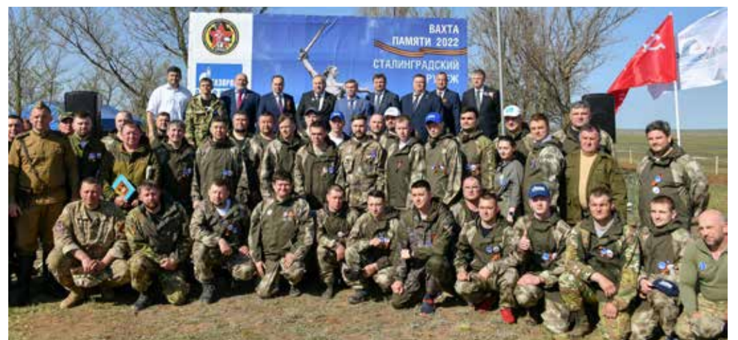
Сводный отряд поисковиков ПАО «Газпром»

В проведении поисковых работ, которые проходили с 25 по 28 апреля, приняли участие порядка 100 поисковиков со всей России, в том числе 50 участников поисковых отрядов из 35 организаций ПАО «Газпром». За четыре дня поисков участники «Вахты Памяти» обнаружили и подняли останки 10 бойцов