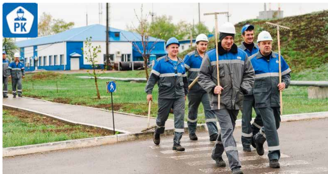
На экологический субботник работники Калининского ЛПУМГ идут как на праздник

— Дан старт «Зеленой весне». Этот экологический марафон традиционно объединяет работников «Газпром трансгаз Волгоград». Спасибо всем, кто заботится об экологии, о чистоте и порядке вокруг нас. В Обществе трудятся неравнодушные сотрудники, которые принимают активное участие в экологических акциях, в благоустройстве производственных территорий и населенных пунктов