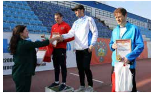
КОМАНДА ОБЩЕСТВА – ПОБЕДИТЕЛЬ РЕГИОНАЛЬНЫХ СОРЕВНОВАНИЙ ПО ГТО