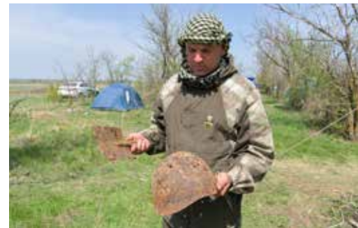
Эхо войны здесь встречается на каждом шагу

Ольга КОСТРЫКИНА