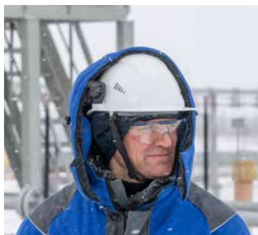
На Заполярном месторождении

Ольга КОСТРЫКИНА.