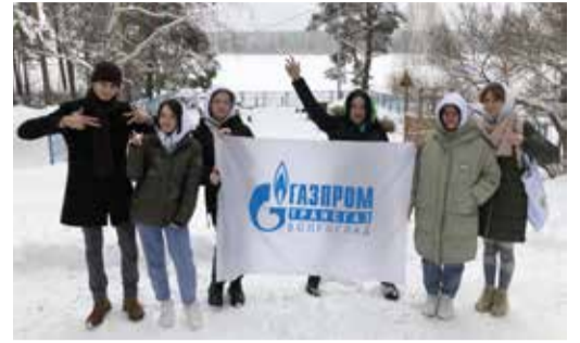
ПЕРВЫЙ ЭКОЛОГИЧЕСКИЙ ЛАГЕРЬ ПАО «ГАЗПРОМ»