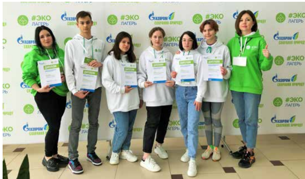
Команда ООО «Газпром трансгаз Волгоград» с дипломами Первого Экологического лагеря ПАО «Газпром»

Финальным этапом стала защита проектов, отвечающих на актуальные экологические вопросы. Команда ООО «Газпром трансгаз Волгоград» успешно представила свой эко-