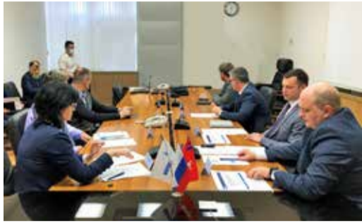
ВОЛГОГРАДСКИЕ ПРЕДПРИЯТИЯ – ГАЗПРОМУ

Информационный бюллетень ООО «Газпром трансгаз Волгоград»