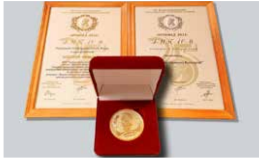
ЗОЛОТО ДЛЯ ИЗОБРЕТАТЕЛЕЙ