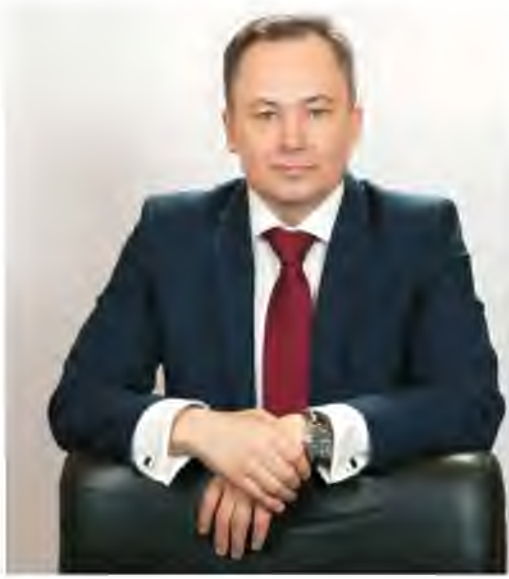
(начало интервью читайте в декабрьском номере за 2021 год)