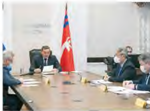
Участники заседания губернаторского совета по развитию промышленности и ТЭК