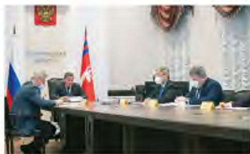
ГУБЕРНАТОРСКИЙ СОВЕТ ОБСУДИЛ ВОПРОСЫ РАБОТЫ В УСЛОВИЯХ ОГРАНИЧИТЕЛЬНЫХ МЕР стр. 2