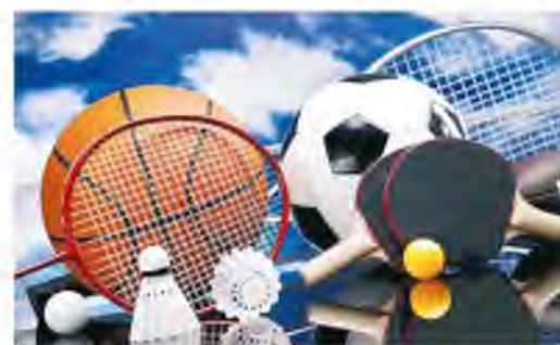
В ООО «ГАЗПРОМ ТРАНСГАЗ ВОЛГОГРАД» ПОДВЕДЕНЫ ИТОГИ КОНКУРСА «ЛУЧШИЙ СПОРТСМЕН 2021 ГОДА» стр. 4

ПОДПИШИТЕСЬ НА ОФИЦИАЛЬНЫЕ АККАУНТЫ ООО «ГАЗПРОМ ТРАНСГАЗ ВОЛГОГРАД» В СОЦИАЛЬНЫХ СЕТЯХ