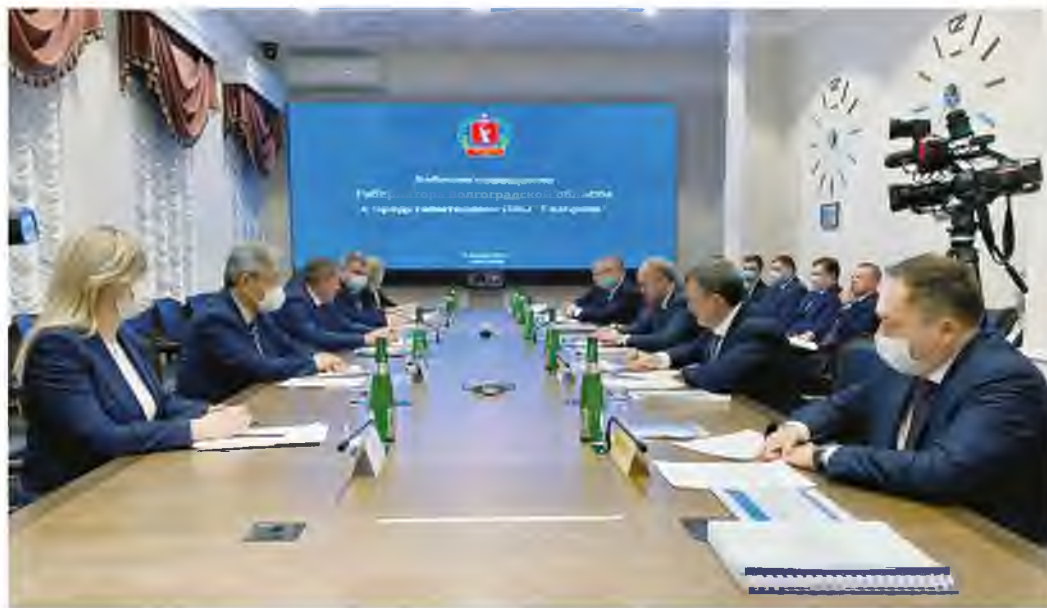
Участники заседания межведомственного штаба по газификации