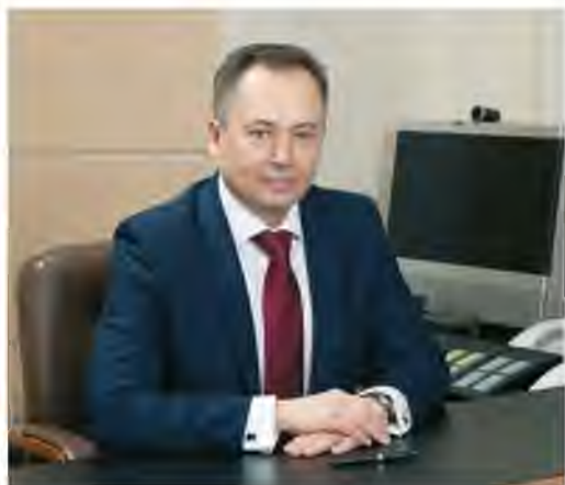
Уважаемые ветераны Великой Отечествен- ной войны, труженики тыла, дети во- енного Сталинграда, коллеги!

От всей души поздравляю вас со знамена- тельной датой – Днем разгрома фашистских войск под Сталинградом!