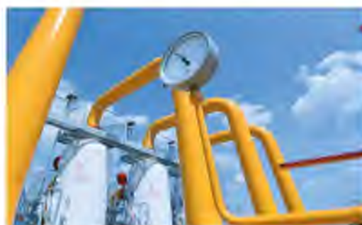
ПОДВОДИМ ИТОГИ ПЯТИЛЕТКИ. ДЕРЖИМ КУРС НА УСТОЙЧИВОЕ РАЗВИТИЕ стр. 3