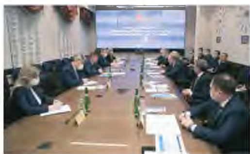
МЕЖВЕДОМСТВЕННЫЙ ШТАБ РАССМОТРЕЛ ВОПРОСЫ ГАЗИФИКАЦИИ ВОЛГОГРАДСКОЙ ОБЛАСТИ стр. 2