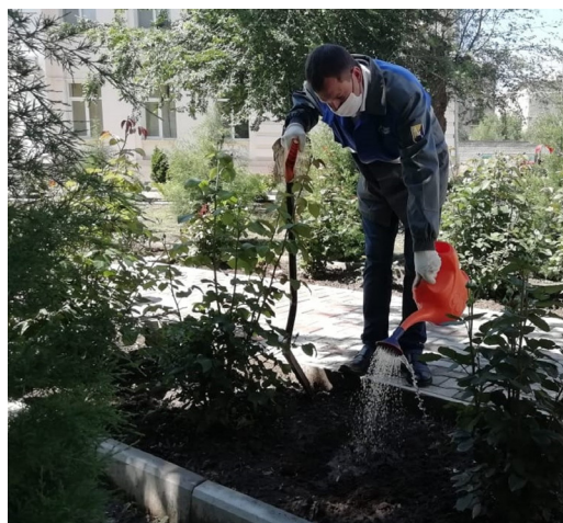
50 кустов роз теперь растут на территории волгоградской школы-интерната №1 для детей с ограниченными возможностями

В рамках проекта Общества «55 добрых дел», в канун Дня эколога молодые специалисты ООО «Газпром трансгаз Волгоград»