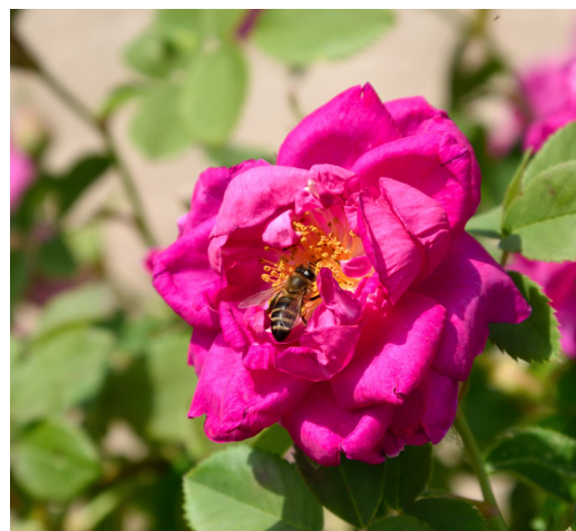
В рамках проекта Общества «55 добрых дел», в канун Дня эколога молодые специалисты ООО «Газпром трансгаз Волгоград» организовали и провели высадку роз на территориях подшефных детских учреждений в Волгограде.

В 2020 году ООО «Газпром трансгаз Волгоград» отмечает 55 лет со дня образования предприятия. 1 августа 1965 года в соответствии с приказом государственного производственного комитета СССР по газовой промышленности от 17 июля 1965 года № 385 было образовано Волгоградское управление магистральных газопроводов. К юбилею Общества в компании запущен большой социальный проект «55 добрых дел». Делать добрые дела газовики будут в течение всего юбилейного года.