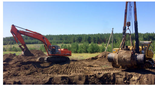
Устранение дефекта при проведении ППР на МГ «Петровск-Новопсков»

обеспечены вагон-домами, КУНГАми, с комфортабельными спальными местами, кухнями, столовыми, телевизорами и радиоприемниками. В местах размещения лагерей установлены навесы для защиты от солнца, для питания установлены столы со скамьями, туалеты. Лагерь оснащен автономным электропитанием. Все это создает условия для обеспечения людям полноценного отдыха после тяжелого рабочего дня.