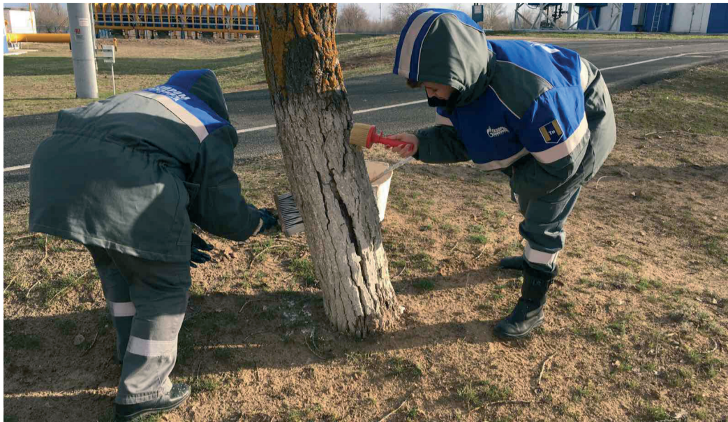
Субботник – это повод обратить внимание на проблемы экологии

Весенняя пора традиционно является сезоном наведения чистоты и благоустройства. 20 марта на генеральную уборку прилегающих к предприятию территорий вышли работники Фроловского ЛПУМГ, давшие старт традиционному месячнику по благоустройству во всех филиалах ООО «Газпром трансгаз Волгоград».