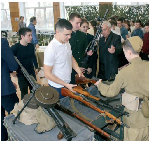
Ребята могли взять в руки винтовку

Специально к 75-летию Великой Победы ООО «Газпром трансгаз Волгоград» организовало и провело передвижную выставку Военно-исторического музея в тех районах, где расположены филиалы компании. В феврале и марте этого года посетители узнали много новых и неожиданных фактов о войне. А популярность выставки среди детей и молодежи, многочисленные благодарности в адрес компании говорят о том, что тема войны и Победы – живет в сердцах россиян. Предлагаем Вашему вниманию статью газеты «Вперед» о том, как выставка прошла во Фроловском районе.