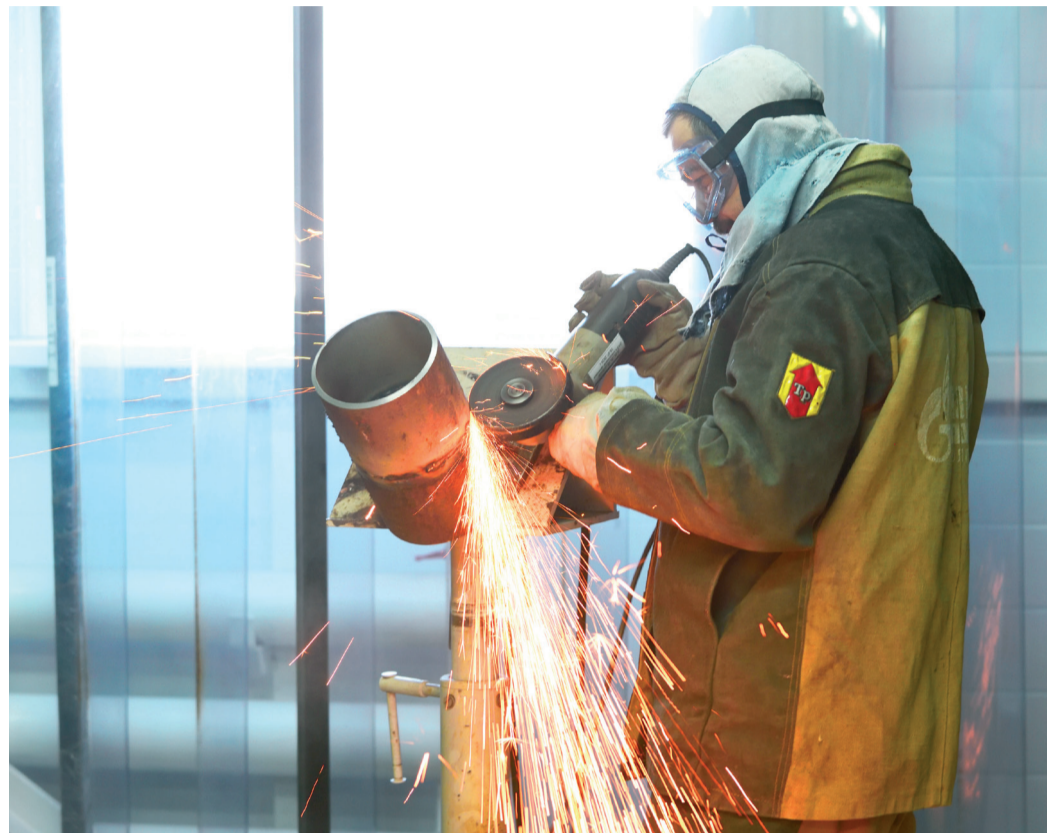
В начале практического этапа конкурса «Лучший сварщик ООО «Газпром трансгаз Волгоград» -2020» участники произвели подготовку, сборку и предварительную сварку контрольных сварных соединений труб

сварных соединений труб диаметром 530 и 159 мм. На втором этапе практического задания работники в присутствии членов конкурсной комиссии осуществляли ручную дуговую сварку контрольных образцов труб. В процессе выполнения работ комиссия оценивала соблюдение техники безопасности, скорость сварки, расход материалов и, конечно, качество работ. За любое нарушение участнику начислялись штрафные баллы. Качество сварки оценивалось тщательно — при помощи визуального и рентгенографического контроля. А для чистоты эксперимента все элементы были пронумерованы, без указания фамилий участников. После прохождения практического этапа участников ждала проверка теоретических знаний в виде тестирования.