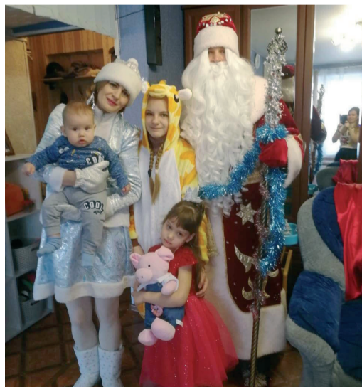
Специалисты СМУС в костюмах Деда Мороза и Снегурочки поздравляют детей с Новым годом

Традиционные новогодние поздравления в торжественной обстановке прошли во всех филиалах ООО «Газпром трансгаз Волгоград». Конкурсные программы, новогодние огоньки, праздничные елки и награждения лучших сотрудников состоялись на местах. С наступающим Новым годом в администрации и филиалах детишек поздравили Дед Мороз, Снегурочка, веселые аниматоры. Сотрудники всех филиалов подошли к празднованию креативно. Так, например, в Горо-