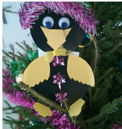
Конкурс новогодней игрушки

дисненском ЛПУМГ и других филиалах организовали не только новогодний концерт, но и конкурс новогодней игрушки. По результатам конкурса проигравших не было – все дети получили подарки, а родители дипломы. В Волгоградском линейном управлении сделали забавный фотоколлаж из жизни управления и поздравительный видеоряд. Во Фролово прошла большая новогодняя елка.