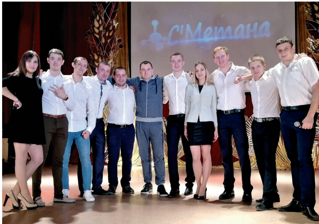
Команда КВН «С'метана» ООО «Газпром трансгаз Волгоград»

С 24 по 28 декабря 2018 года на сайте Межрегиональной профсоюзной организации «Газпром профсоюз» прошло интернет-голосование Конкурса видеороликов среди команд КВН дочерних обществ и организаций ПАО «Газпром». Организатором конкурса выступил Координационный молодежный совет дочерних обществ и организаций ПАО «Газпром» при поддержке Департамента ПАО «Газпром» и Межрегиональной профсоюзной организации «Газпром профсоюз».