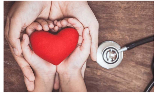
ПРОФИЛАКТИКА СЕРДЕЧНО-СОСУДИСТЫХ ЗАБОЛЕВАНИЙ РАБОТНИКОВ ООО «ГАЗПРОМ ТРАНСГАЗ ВОЛГОГРАД» стр. 4