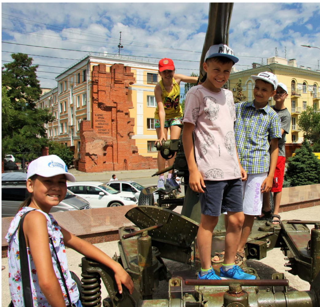
Юные участники проекта смогли прикоснуться к военной технике времен Великой Отечественной войны

– Когда я рассматривала разрушенную мельницу, во мне рождались новые чувства – скорбь и боль, и вместе с тем беско-