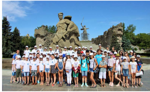
ПРОЕКТ ООО «ГАЗПРОМ ТРАНСГАЗ ВОЛГОГРАД» «СТАЛИНГРАДСКИЙ РУБЕЖ» НАБИРАЕТ ОБОРОТЫ стр. 3