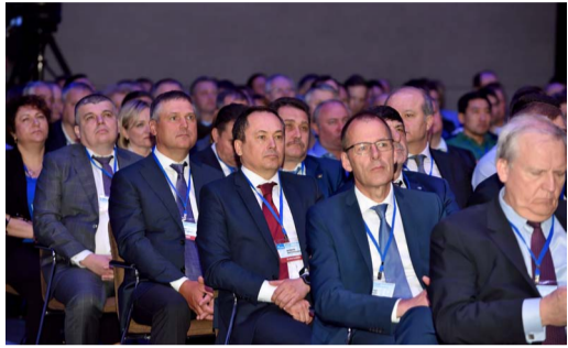
«СТРАТЕГИЯ ВЫСОКИХ ДОСТИЖЕНИЙ» Доклад Алексея Миллера на годовом Общем собрании акционеров стр. 2