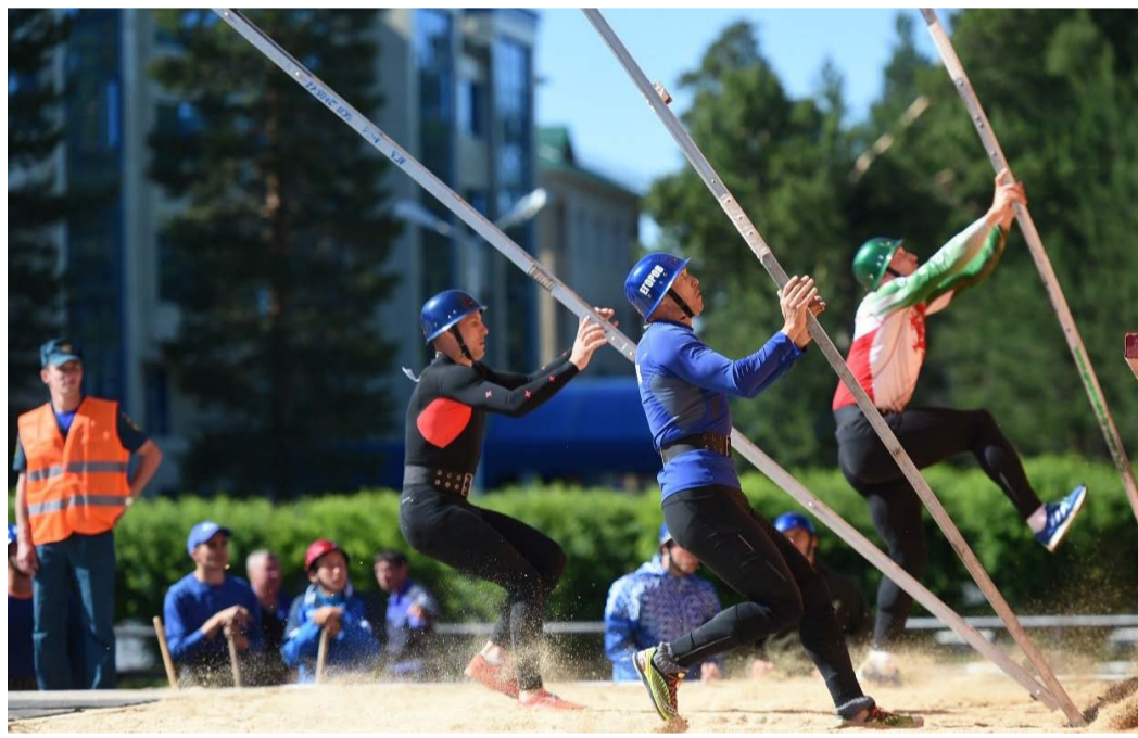
Подъем по штурмовой лестнице в окно четвертого этажа

Алена ВЛАДИМИРСКАЯ