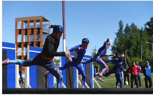
СОРЕВНОВАНИЯ ПО ПОЖАРНО- ПРИКЛАДНОМУ СПОРТУ СРЕДИ ДОЧЕРНИХ ОБЩЕСТВ ПАО «ГАЗПРОМ» стр. 4