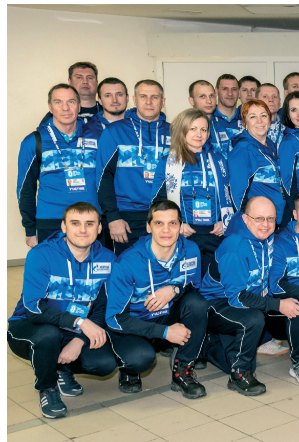
Сборная ООО «Газпром трансгаз Волгоград» получила бескомпромиссной борьбе.

В этом году зимнюю Спартакиаду ПАО «Газпром» принимала столица Урала – Екатеринбург. В Спартакиаде приняли участие 25 взрослых и 11 детских команд, представляющих 27 дочерних обществ «Газпрома» из России и Беларуси. На девяти спортивных объектах Екатеринбурга около 1400 спортсменов боролись за 138 наград в шести видах спорта: баскетболе, волейболе, лыжных гонках, мини-футболе, настольном теннисе и пу-