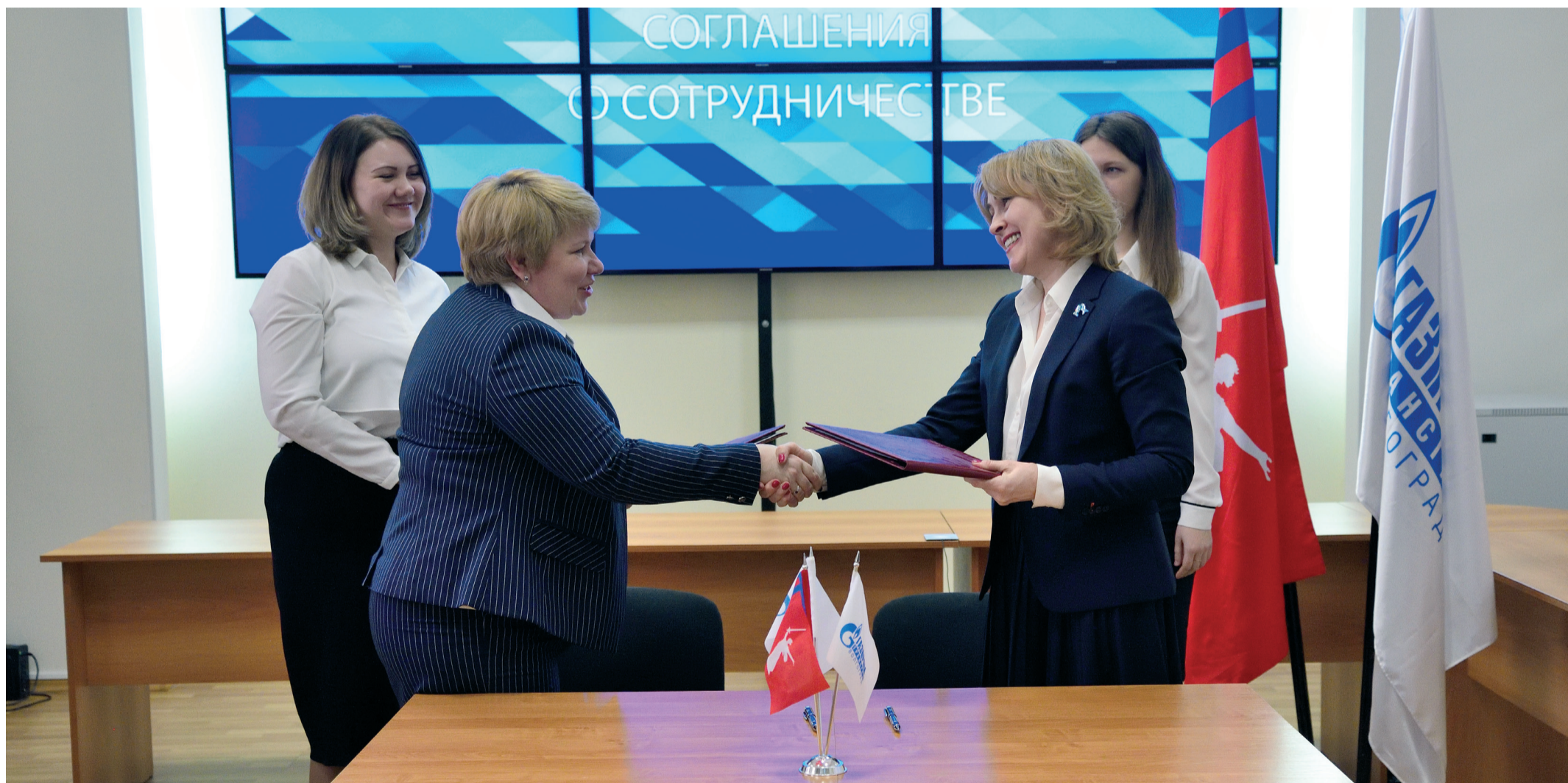
Подписание Соглашения о сотрудничестве стороны по традиции скрепили дружеским рукопожатием

В марте 2019 года в Волгограде состоялось подписание Соглашения о сотрудничестве между Комитетом образования, науки и молодежной политики Волгоградской области и ООО «Газпром трансгаз Волгоград».