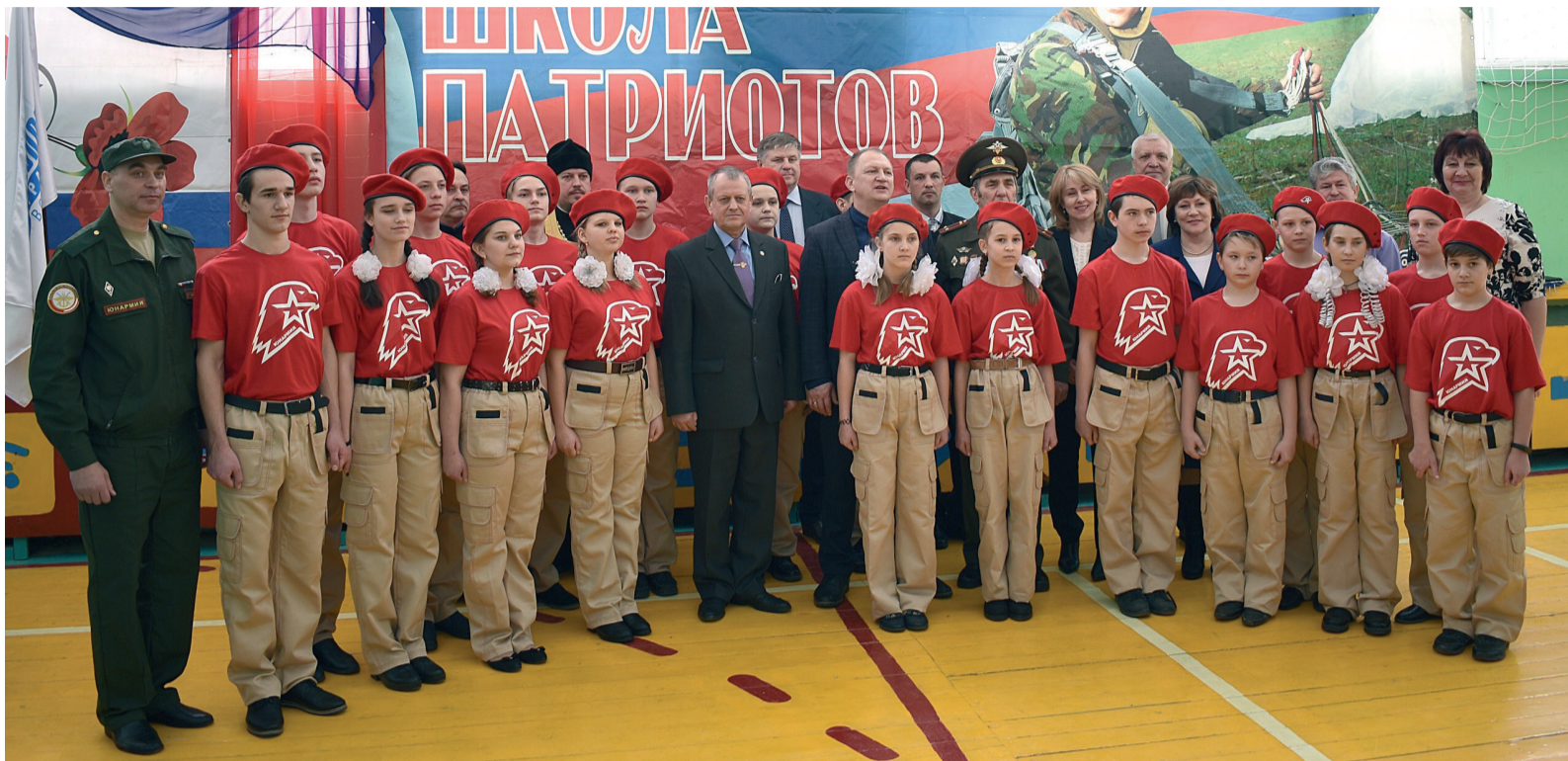
Торжественную клятву юнармейца в Бубновской средней школе Урюпинского района произнесли 20 ребят

21 февраля в Бубновской средней школе Урюпинского района состоялся торжественный прием учащихся 5-10 классов в отряд военно-патриотического движения «Юнармия», созданный при поддержке ООО «Газпром трансгаз Волгоград».