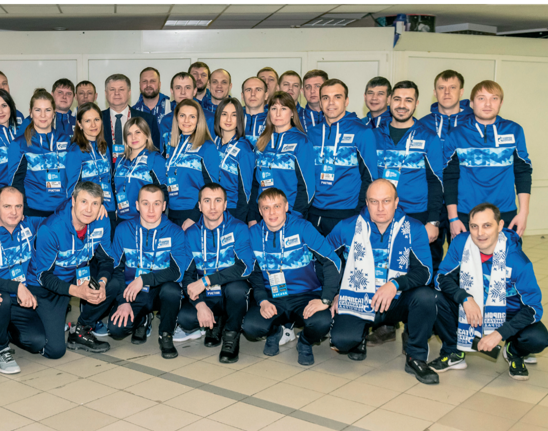
Единственный соревновательный опыт на спортивных площадках Спартакиады ПАО «Газпром»

на лыжах – это целая наука! Необходимо постоянно быть начеку, держать под контролем дистанцию, равномерно распределять силы на трассе, правильно подготовить лыжи к гонке. Всеми этими качествами обладали представители команд-газовиков из северных регионов России. Южанам, к числу которых относится и наша команда, было значительно труднее.