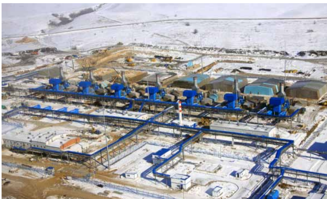
Строительство компрессорного цеха на КС «Писаревка»

Евгений Осадчий