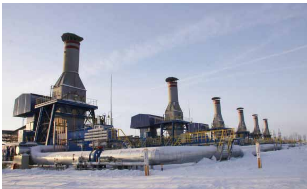
Компрессорный цех № 2 КС «Бубновская»