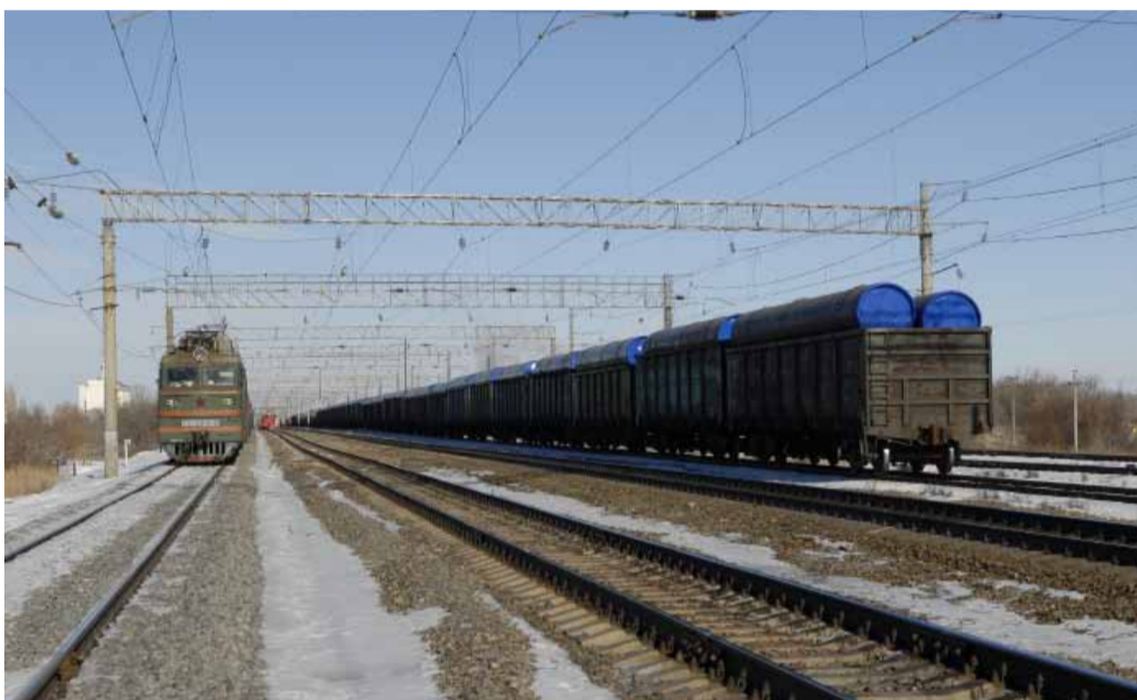
Составы с трубой на станции «Зензеватка»