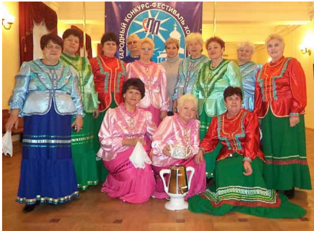
Хор ветеранов Логовского ЛПУМГ «Родные напевы»

В ноябре 2014 года в г. Сергиев Посад состоялся международный конкурс – фестиваль «Битва хоров Подмосковья». При поддержке ООО «Газпром трансгаз Волгоград» Волгоградскую область представлял хор «Родные напевы» из села Лог.