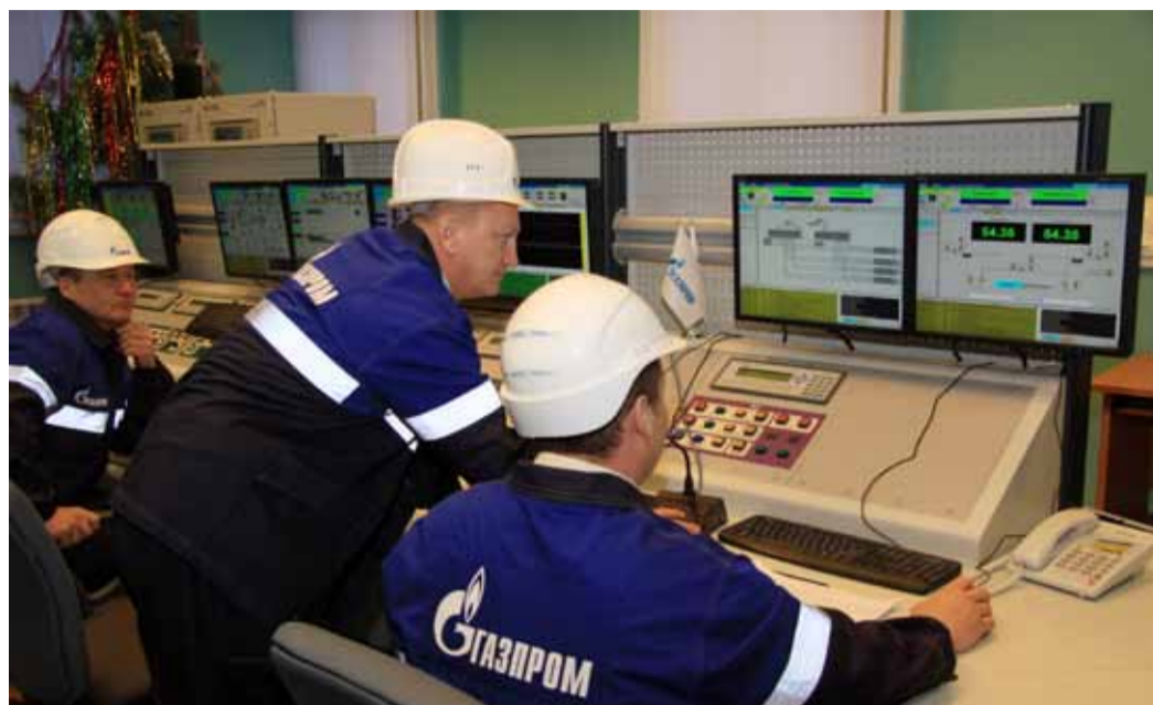
Момент пуска компрессорного цеха 2 КС «Бубновская»