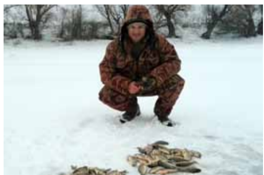
Солидный улов для зимней рыбалки