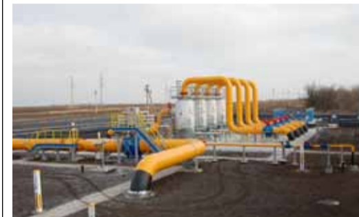
Пылеуловители компрессорного цеха № 2 КС «Бубновская»

В начале декабря минувшего года Россия приняла решение отказаться от проекта газопровода «Южный поток», поскольку Еврокомиссия так и не санкционировала его реализацию и Болгария не дала разрешения на строительство на своей территории. При этом Москва достигла договоренности с Анкарой о строительстве газопровода аналогичной мощности (63 млрд кубометров в год) через Турцию до границы с Грецией, где может быть создан газовый хаб для потребителей Южной Европы.