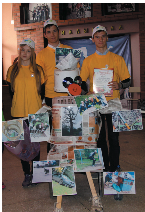
Арт-инсталляция экоотряда "Зеленый шум"