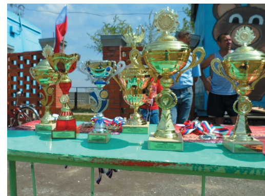
Эти кубки достались победителям соревнований

В общекомандном зачете места распределились следующим образом: первое место заняла команда из Антиповского ЛПУМГ, второй стала команда Логовского ЛПУМГ, третьими стали хозяева — команда Ольховского ЛПУМГ и на четвертом месте команда нефтя-