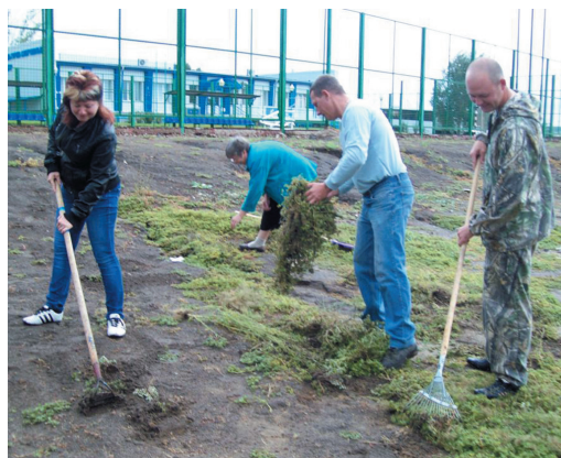
Уборка спортплощадки в Калининском ЛПУМГ

Корр. ВТ Фото представлены филиалами ООО «Газпром трансгаз Волгоград»