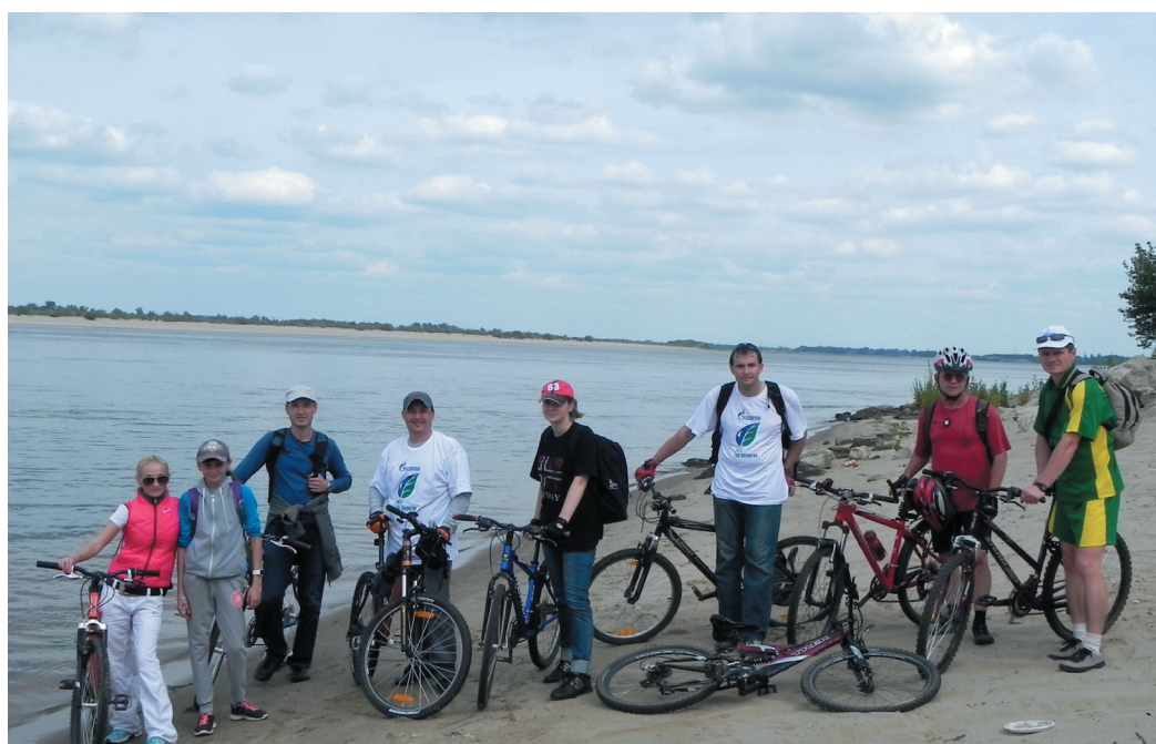
Велопробег завершился на живописном берегу Волги