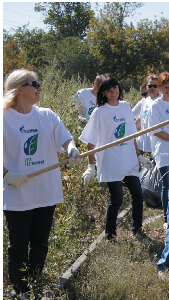
Аппарат управления на уборке территории, прилегающей к...