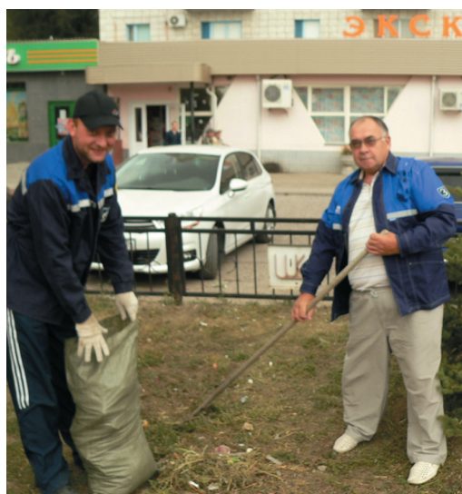
Фроловское ЛПУМГ убирало городской парк