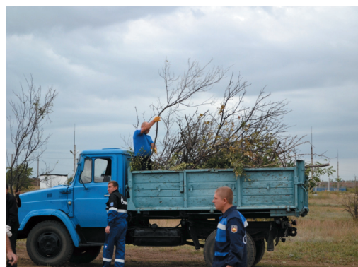
В Логовском ЛПУМГ обрезают сухие деревья