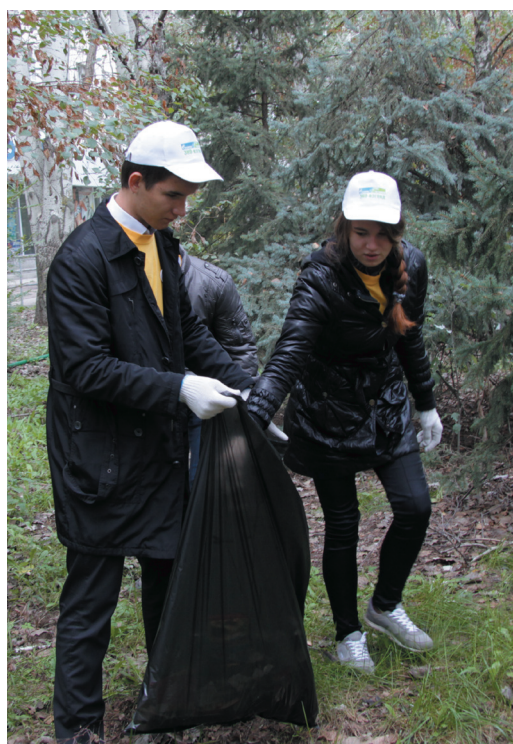
Волжский станет чище

Студенты и школьники города Волжский собрались в ДК «Юность», чтобы сделать свой город чуточку лучше и чище. В рамках Года экологии ОАО «Газпром», при поддержке ООО «Газпром трансгаз Волгоград» ребята приняли участие в акции «Эко-взгляд», которая проводилась в модном молодежном формате «флешмоб».