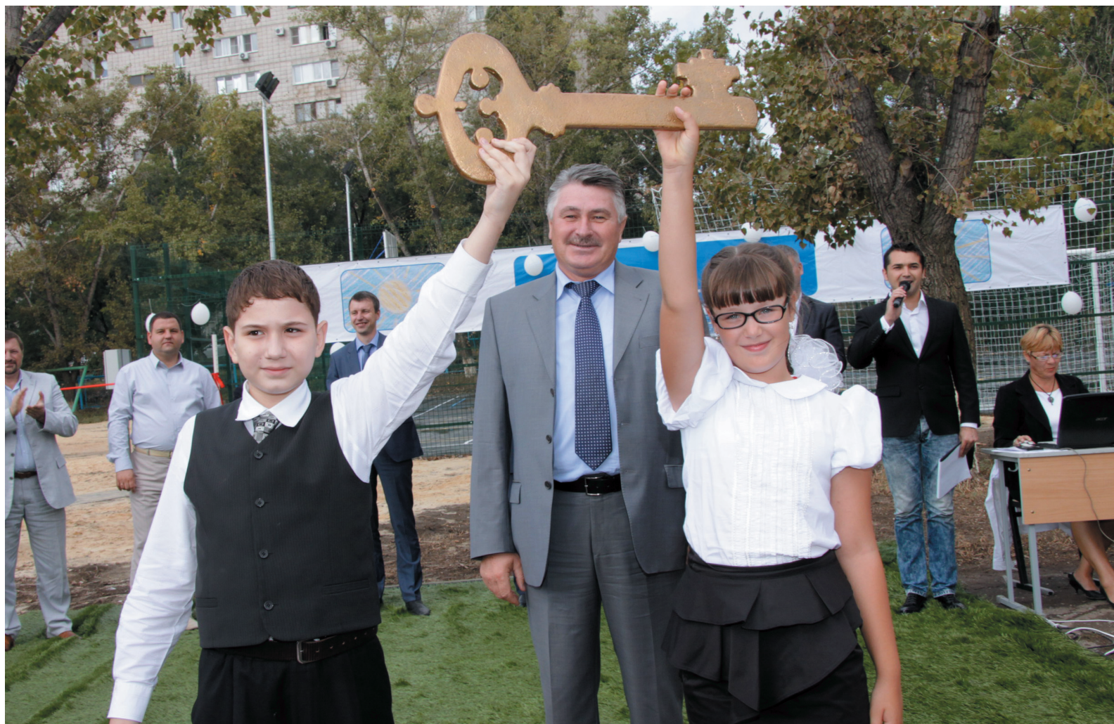
Символический ключ от площадки в надежных руках лицестов

В сентябре 2013 года в Краснооктябрьском районе Волгограда, на базе Лицея N2 состоялось торжественное открытие многофункциональной спортивной площадки. Реализация данного проекта стала возможной благодаря проекту «Газпром – детям». Генеральным заказчиком строительства явилось ООО «Газпром трансгаз Волгоград».