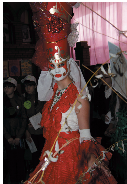
Костюм модели выполнен из картофельных сеток

Во флешмобе приняли участие студенты экологического отряда Волжского гуманитарного института, экологический отряд школы № 14 «Зеленый шум», детско-юношеское объединение «Наследие», экологический театр моды (есть даже такой!) школы № 29 и волжская детская станция юннатов. Все пять команд отправились по заранее нанесенным на карту Волжского маршрутам в экологическую командировку. За время акции каждой команде необходимо было сделать не менее десяти фотографий мест, требующих экологической помощи — «ЭКО-SOS», а также собрать по 20 мешков мусора. Но на этом программа флешмоба не окончилась. Через три часа ребята вновь собрались в