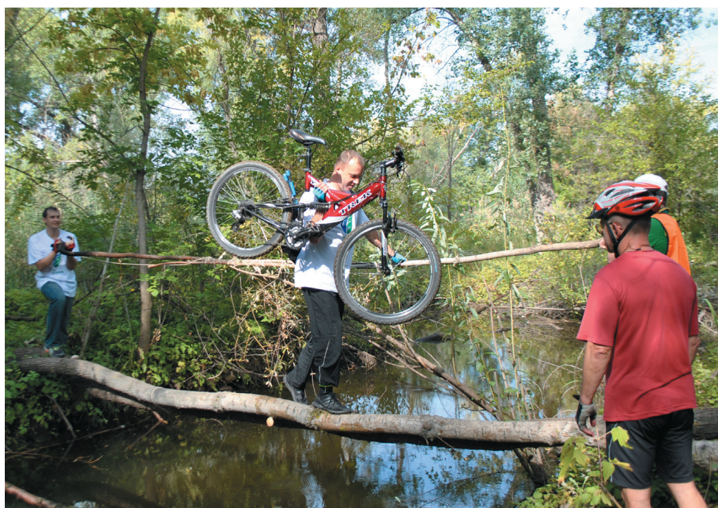
Штурм ерика с помощью подручных средств, подготовленных бобрами

Павел Алимов