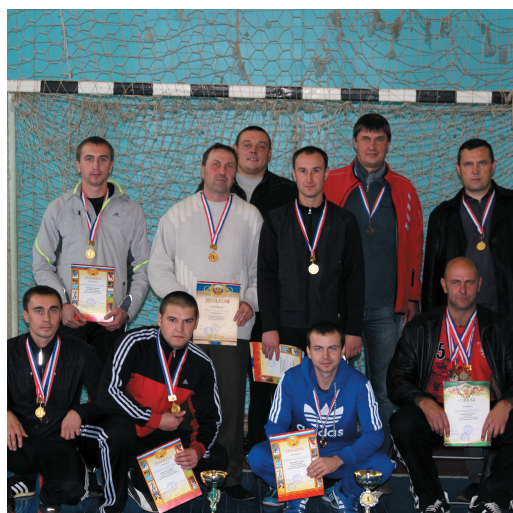
Сборная Калачеевского ЛПУМГ

28 сентября в городе Калаче, в физкультурно-оздоровительном комплексе, была открыта Зональная спартакиада