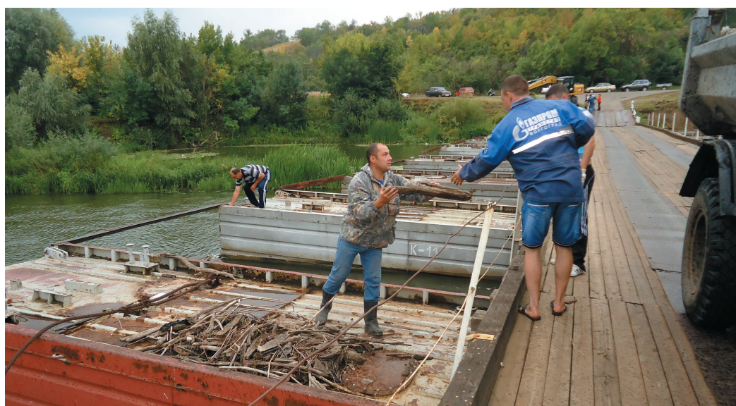
Работники Бубновского ЛПУМГ привели в порядок понтонный мост через Хопер