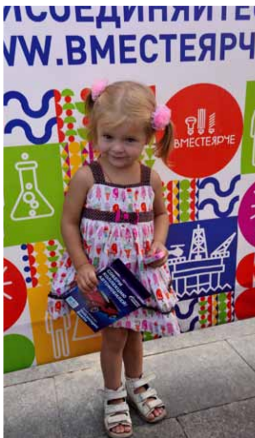
Вопросы энергосбережения и экологии важны для всех!

31 августа в рамках празднования 430 годовщины со дня основания г. Волгограда на Центральной набережной города прошли мероприятия регионального этапа Всероссийского фестиваля энергосбережения #ВместеЯрче, проводимого Министерством энергетики России.