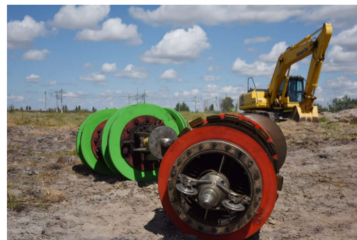
Поршни едут своей отправкой в газопровод