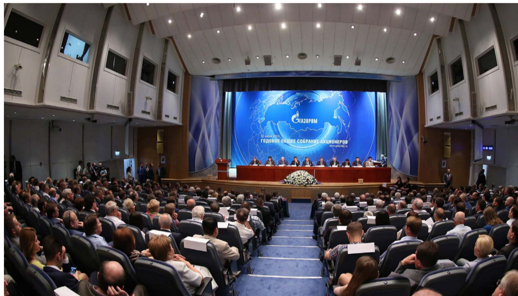
Годовое Общее собрание акционеров ПАО «Газпром» открыто

30 июня в Москве прошло годовое Общее собрание акционеров ПАО «Газпром», на котором были обсуждены ключевые вопросы, касающиеся работы компании в прошедшем году.