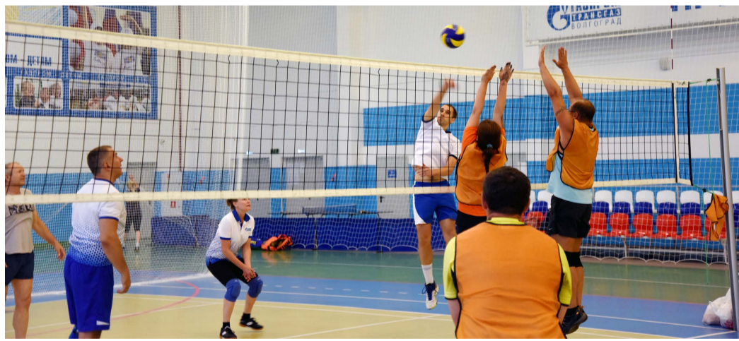
Тренировка сборной Общества по волейболу

В июне 2016 года руководством Общества было утверждено и введено в действие Положение о спортивной сборной команде ООО «Газпром трансгаз Волгоград», утвержден Организационный комитет по подготовке и проведению физкультурно-оздоровительных и спортивных мероприятий. Практически сразу на базе Культурно-спортивного комплекса начались тренировочные занятия спортивной сборной команды Общества по всем видам спорта.