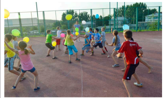
Детский праздник удался на славу

Уже не первый год Калининское ЛПУМГ проводит спортивно-развлекательные мероприятия, посвященные Дню семьи, любви и верности.