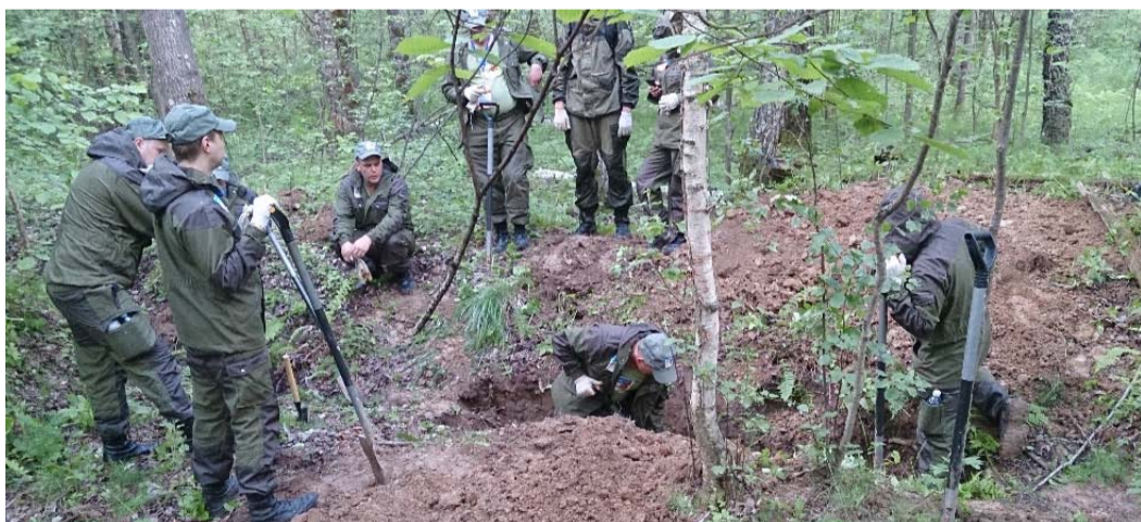
Раскопки на Калужской земле

Специалисты ООО «Газпром трансгаз Волгоград» с 13 по 23 июня приняли участие в международной военно-патриотической акции «Вахта памяти – 2016», организованной на территории Калужской области.