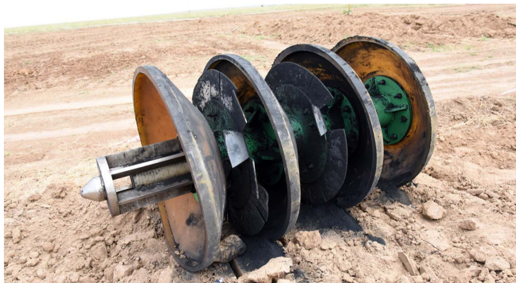
Калибровочный поршень после прохождения дефектного участка

Полным ходом идут работы по проведению капитальных ремонтов газопроводов. За первое полугодие Обществом отремонтировано более 37 км газовых магистралей. Близятся к завершению работы по проведению внутритрубной диагностики. Из запланированных 521,2 км за первое полугодие обследовано 411,5 км газопроводов. В конце июля работы по ВТД проводились на первой нитке газопровода Лог-Конный.