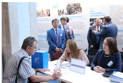
Вопросы решаются оперативно