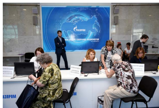
Регистрация участников собрания

Алексей Самохин