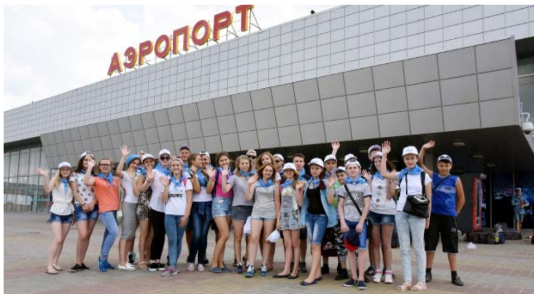
Скоро, скоро долгожданный Крым!

Первая смена детей сотрудников ООО «Газпром трансгаз Волгоград» 12 июля впервые отправились на детский оздоровительный отдых в лагерь солнечного Крыма. Ребята будут отдыхать в лагере «Арт-квест» (г. Саки) и детском центре «Жемчужный берег» (г. Ялта).