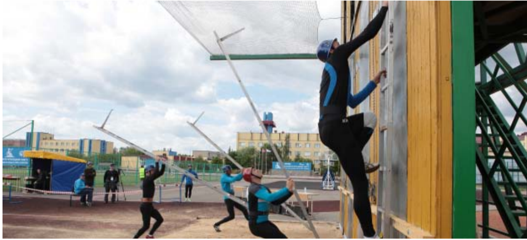
Подъем по штурмовой лестнице в окно четвертого этажа учебной башни

С 7 по 10 июня 2016 года на базе командно-инженерного института МЧС Республики Беларусь в г. Минске состоялись юбилейные соревнования по пожарно-прикладному спорту среди дочерних обществ ПАО «Газпром».