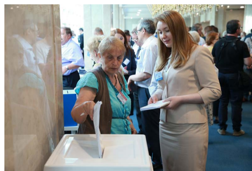
Голосование по вопросам повестки собрания