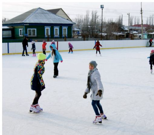
Больше всего рады открытию катка дети

Уже в день открытия на катке яблоку было негде упасть — дети и взрослые катались на коньках, разучивали элементы фигурного ка-