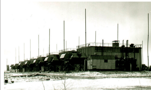
Компрессорная станция почти достроена

На территории Шолоховского района располагается одно из крупных предприятий района — Калининское ЛПУМГ ООО «Газпром трансгаз Волгоград». Официально датой образования управления считается 21 января 1976 года. Именно в этот день руководством по производственному объединению «Волгоградтрансгаз» был подписан приказ № 28 об его создании.