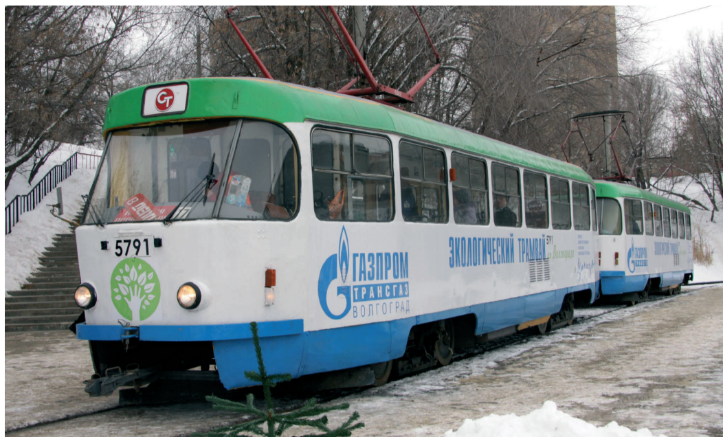
Экологический трамвай выходит на рейс

им. В.И. Вернадского в номинации «Экологическое воспитание и просвещение».