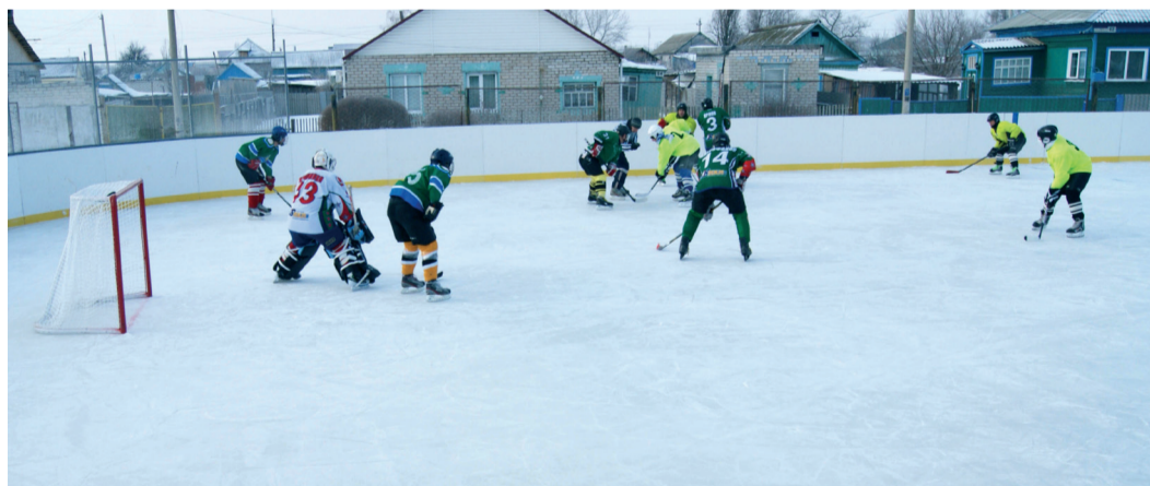
Первый хоккейный матч на площадке после ее открытия

24 января 2016 года в р.п. Иловля Волгоградской области состоялось открытие ледового катка, построенного при поддержке ООО «Газпром трансгаз Волгоград».