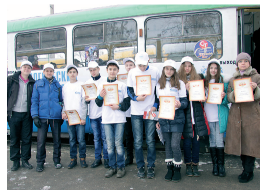
Дипломы лучшим экологическим экскурсоводам

В Волгограде появился бело-голубой «экологический» трамвай». 27 января пассажиры скоростного трамвая стали участниками увлекательной экскурсии, которую организовали юные экологи и МУП «Электротранс» при поддержке ООО «Газпром трансгаз Волгоград».