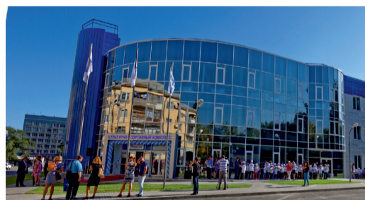
Приходите в Культурно-спортивный комплекс!

25 сентября прошлого года, в день празднования 50-летия ООО «Газпром трансгаз Волгоград» в Волгограде был открыт культурно-спортивный комплекс, построенный по программе «Газпром – детям». До настоящего момента комплекс работал только в тестовом режиме, но теперь он начинает оказывать услуги в полном объеме.