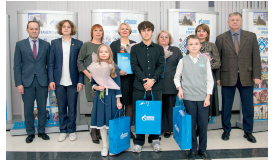
В ООО «ГАЗПРОМ ТРАНСГАЗ ВОЛГОГРАД» НАГРАДИЛИ САМЫХ АКТИВНЫХ УЧАСТНИКОВ ВОЛОНТЕРСКОГО ДВИЖЕНИЯ