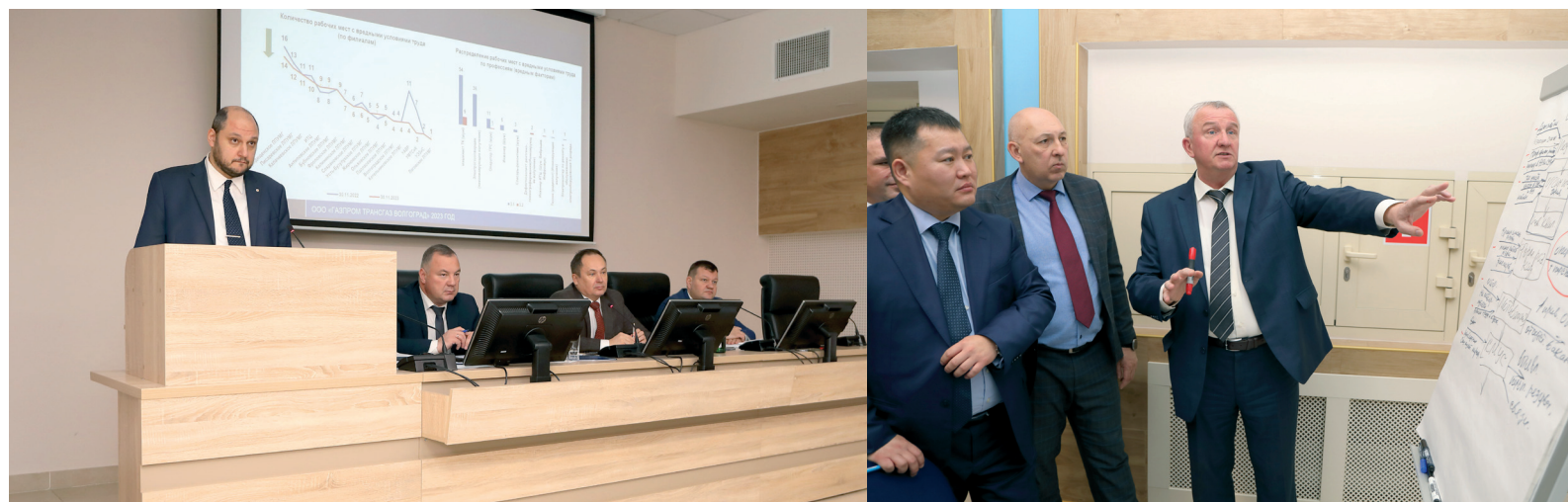
Совет руководителей «Газпром трансгаз Волгоград» заслушал доклады по основным видам деятельности предприятия и рассмотрел самые острые производственные вопросы

С 18 по 21 декабря в администрации Общества состоялось заседание Совета руководителей ООО «Газпром трансгаз Волгоград». Начальники филиалов компании, отделов и служб Администрации подвели итоги работы предприятия в 2023 и обсудили задачи на предстоящий 2024 год.