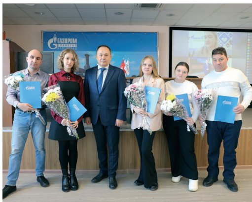
Награждение самых активных волонтеров Фроловского управления

В Международный день добровольцев в администрации и филиалах ООО «Газпром трансгаз Волгоград» наградили самых активных участников волонтерского движения компании. В этот день цветы и аплодисменты были адресованы тем, кто по зову сердца и не смотря ни на какие личные обстоятельства, находит в себе силы помогать тем, кто в этом нуждается.