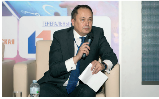
СОВЕТ РУКОВОДИТЕЛЕЙ ОБЩЕСТВА ПОДВЕЛ ИТОГИ УХОДЯЩЕГО ГОДА И НАМЕТИЛ ПЛАНЫ НА 2024 ГОД