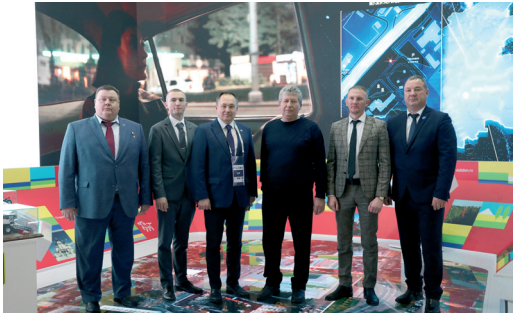
РАБОТНИКИ ОБЩЕСТВА ПОСЕТИЛИ ПРЕСТИЖНУЮ МЕЖДУНАРОДНУЮ ВЫСТАВКУ «РОССИЯ»