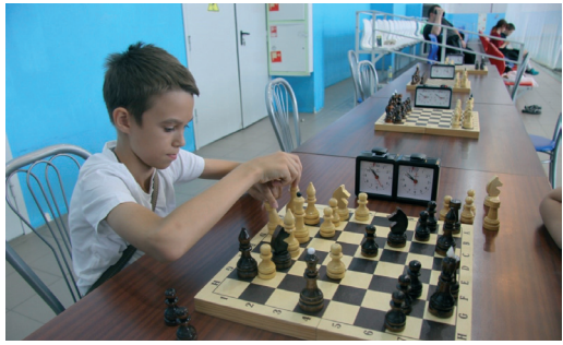
Юные шахматисты проявили чудеса стойкости и терпения – никто не хотел проигрывать

В дни летних школьных каникул в Обществе при поддержке ОППО «Газпром трансгаз Волгоград профсоюз» организовали и провели летний детский турнир среди детей работников Объединения «Газпром в Волгоградской области».