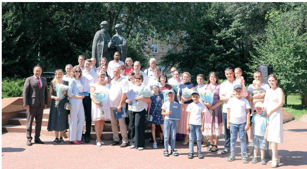
Пятнадцать семейных пар – работников Общества получили благодарственные письма за сохранение института семьи