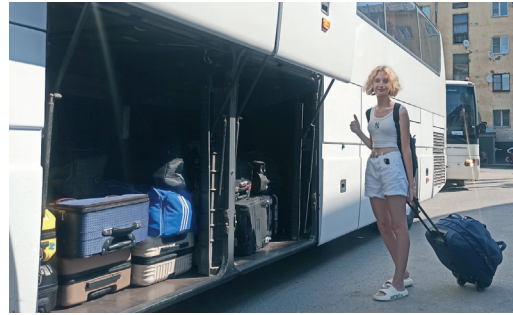
БОЛЕЕ 400 ДЕТЕЙ РАБОТНИКОВ КОМПАНИИ ОТДОХНУТ ЭТИМ ЛЕТОМ В ОЗДОРОВИТЕЛЬНЫХ ЛАГЕРЯХ стр. 2