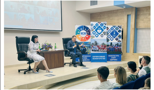
В «ГАЗПРОМ ТРАНСГАЗ ВОЛГОГРАД» СОСТОЯЛСЯ ДЕНЬ ЦЕЛЕВОГО СТУДЕНТА стр. 4

ПОДПИШИТЕСЬ НА ОФИЦИАЛЬНЫЕ ИНФОРМАЦИОННЫЕ РЕСУРСЫ ООО «ГАЗПРОМ ТРАНСГАЗ ВОЛГОГРАД»