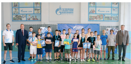
Победители соревнований получили заслуженные медали и сладкие подарки