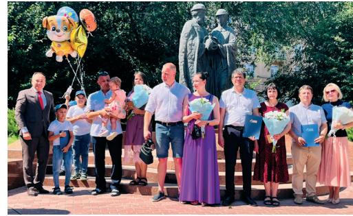
В ОБЩЕСТВЕ ПОЗДРАВИЛИ СУПРУЖЕСКИЕ ПАРЫ С ДНЕМ СЕМЬИ, ЛЮБВИ И ВЕРНОСТИ стр. 4