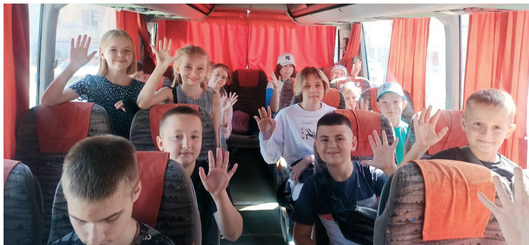
Лагерь зовет: дети работников к летнему оздоровительному отдыху и новым впечатлениям готовы

Более 400 детей работников Общества этим летом проведут свои каникулы в оздоровительных лагерях «Мульт-Фильм», «Босоногий гарнизон» и «Солнышко» в соответствии с программой, предусмотренными Коллективным договором Общества. Ребята смогут насладиться отдыхом на свежем воздухе, зарядиться энергией, обрести новых друзей, продемонстрировать свои умения и таланты и набраться впечатлений на год вперед.