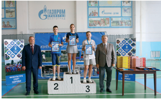
В ОБЩЕСТВЕ «ГАЗПРОМ ТРАНСГАЗ ВОЛГОГРАД» ПРОВЕЛИ ДЕТСКУЮ СПОРТИВНУЮ СПАРТАКИАДУ стр. 2