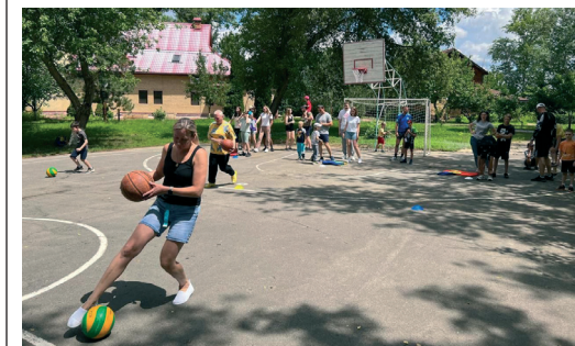
В рамках программы турслета прошли разнообразные эстафеты для родителей и их детей

1 июля в парк-отеле «Пересвет» для молодых работников и членов их семей из администрации, Городищенского ЛПУМГ, УАВР, УМТСиК, ИТЦ, УЭЗиС, УОВОФ прошел спортивно-туристический слет молодых работников Общества «Газпром трансгаз Волгоград».