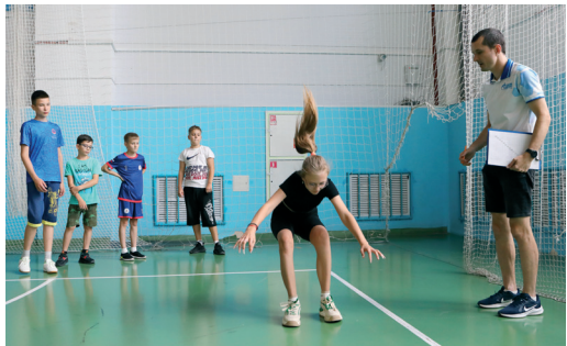
Соревнования по прыжкам в длину

В соревнованиях приняли участие 48 ребят из 7 предприятий Объединения «Газпром» в Волгоградской области: ООО «Газпром трансгаз Волгоград», ООО «Газпром межрегионгаз Волгоград», ООО «Газпром газораспреде-