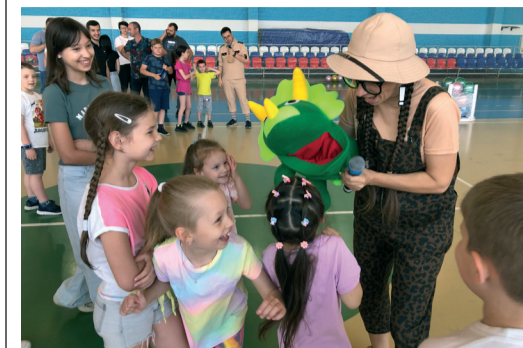
Игры понравились всем, даже самым маленьким участникам

3 июня в ООО «Газпром трансгаз Волгоград» состоялся эко-спортивный праздник «Здоровье и экология», приуроченный к Всемирному дню охраны окружающей среды. В мероприятии приняли участие работники и их семьи из подразделений и филиалов, расположенных в Волгограде, а также гости - представители объединения «Газпром в Волгоградской области».