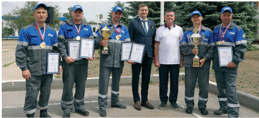
Сборная команда Бубновского ЛПУМГ — победитель конкурса

В городе Фролово Волгоградской области состоялся 13-й конкурс профессионального мастерства среди добровольных пожарных команд филиалов ООО «Газпром трансгаз Волгоград». Цель соревнований — поддержание уровня профессиональной подготовки добровольных пожарных и проверка готовности к ликвидации возможных пожаров. В соревнованиях приняли участие команды, представляющие 14 филиалов Общества.