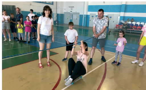
В «ГАЗПРОМ ТРАНСГАЗ ВОЛГОГРАД» СОСТОЯЛСЯ ПРАЗДНИК СПОРТА И ЭКОЛОГИИ стр. 3