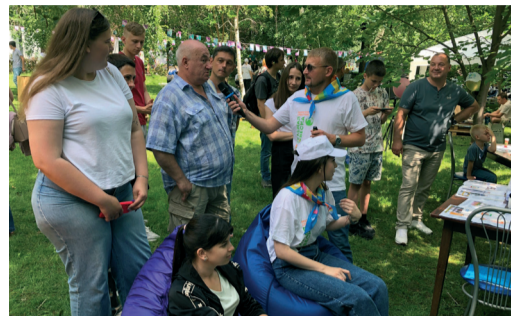
#ТРИЧЕТЫРЕ: РАБОТНИКИ ОБЩЕСТВА ПРИНЯЛИ УЧАСТИЕ В РЕГИОНАЛЬНОМ МОЛОДЕЖНОМ ФЕСТИВАЛЕ стр. 4