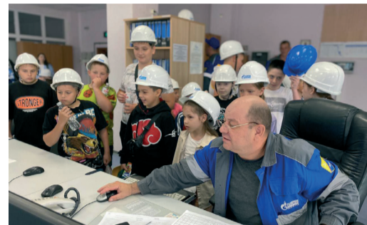
ДЕТИ РАБОТНИКОВ «ГАЗПРОМ ТРАНСГАЗ ВОЛГОГРАД» ПОБЫВАЛИ НА РАБОТЕ У РОДИТЕЛЕЙ стр. 4