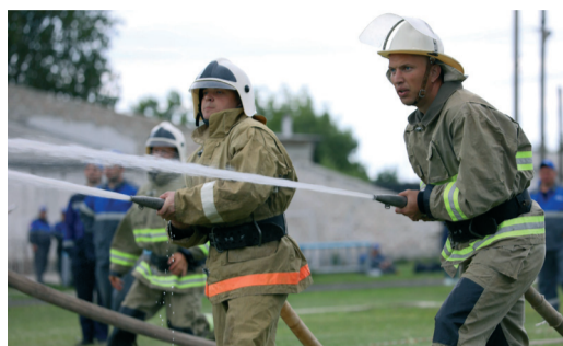
ОПРЕДЕЛЕНЫ ЛУЧШИЕ ДОБРОВОЛЬНЫЕ ПОЖАРНЫЕ КОМАНДЫ ОБЩЕСТВА стр. 2

Информационный бюллетень ООО «Газпром трансгаз Волгоград»