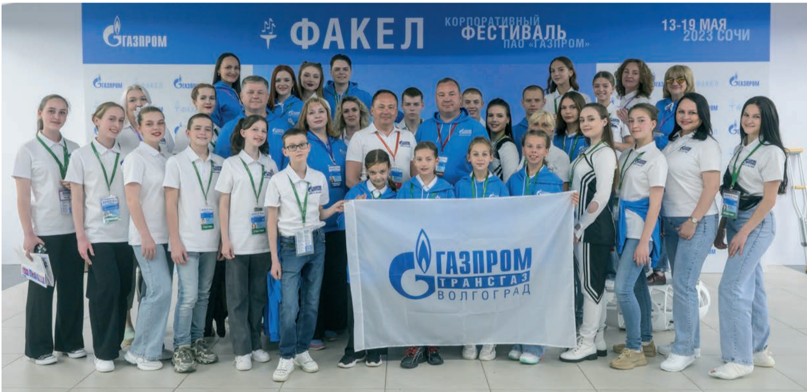
Делегация «Газпром трансгаз Волгоград» на фестивале «Факел» в Сочи

Участники команды «Газпром трансгаз Волгоград» вошли в число победителей корпоративного фестиваля «Факел». В течение трех дней артисты поразили своими талантливыми выступлениями профессиональных членов жюри и зрителей. По мнению жюри участники «Газпром трансгаз Волгоград» смогли раскрыть на сцене «Факела» свой талант и проявили волю к победе, заняв призовые места.