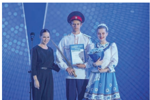
Детский фольклорный ансамбль песни и танца «Донской родничок» – обладатель «бронзы»