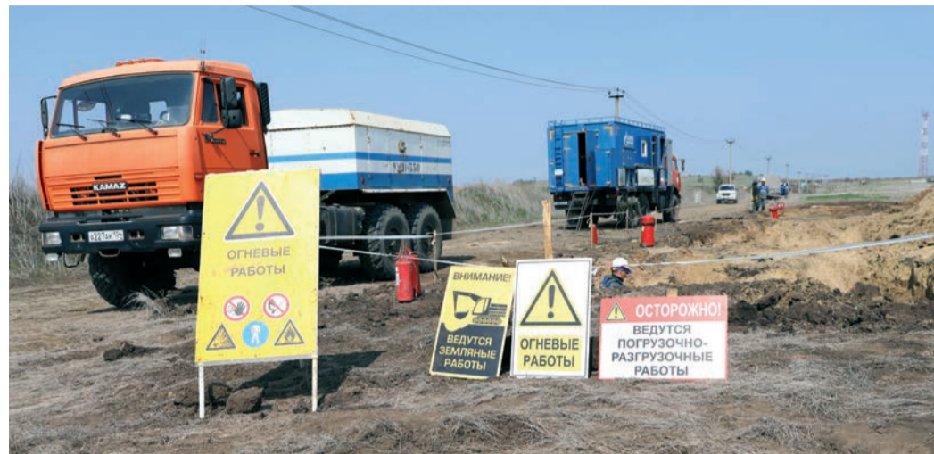
Проведение ППР на участке Ольховского ЛПУМГ

В ООО «Газпром трансгаз Волгоград» проведен комплекс планово-предупредительных ремонтных (ППР) и диагностических работ на участке магистрального газопровода (МГ) «Починки – Изобильное – ССПХГ». Работы велись в зоне ответственности Жирновского, Ольховского, Волгоградского и Котельниковского ЛПУМГ. Для производства работ был отведен временной промежуток с 15 по 25 мая 2023 года.