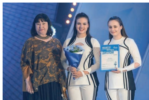
Вокальный ансамбль VIVA CANTU Общества занял 2 место в категории эстрадный вокал