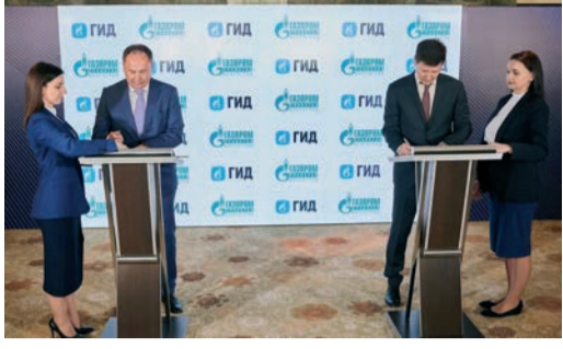
В ходе совещания было подписано Соглашение и «Дорожная карта реализации совместных проектов «Оператор Газпром ИД» и «Газпром трансгаз Волгоград»

18 мая прошло совещание «Задачи, возможности развития мобильного приложения ГИД: инструменты руководителя» для генеральных директоров дочерних обществ «Газпрома». В ходе совещания было подписано Соглашение и «Дорожная карта реализации совместных проектов «Оператор Газпром ИД» и «Газпром трансгаз Волгоград».