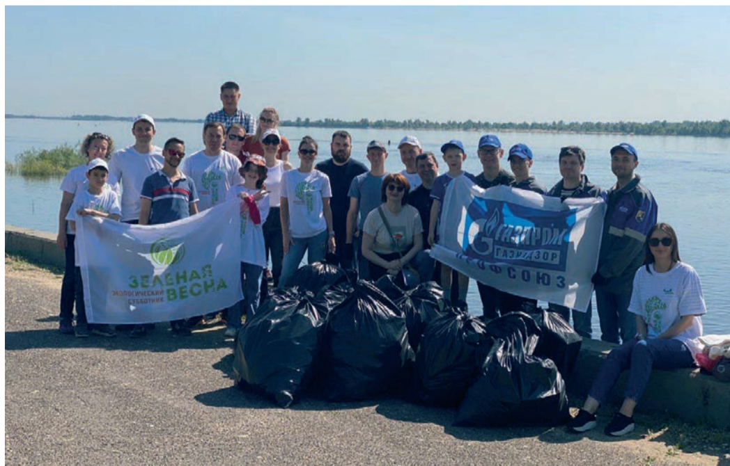
Работники Администрации, волгоградских подразделений Общества, представители предприятий объединения «Газпром в Волгоградской области» провели уборку на правом берегу Волги, на территории, прилегающей к пляжу микрорайона им. Тулака

Ирина ГАНТИМУРОВА