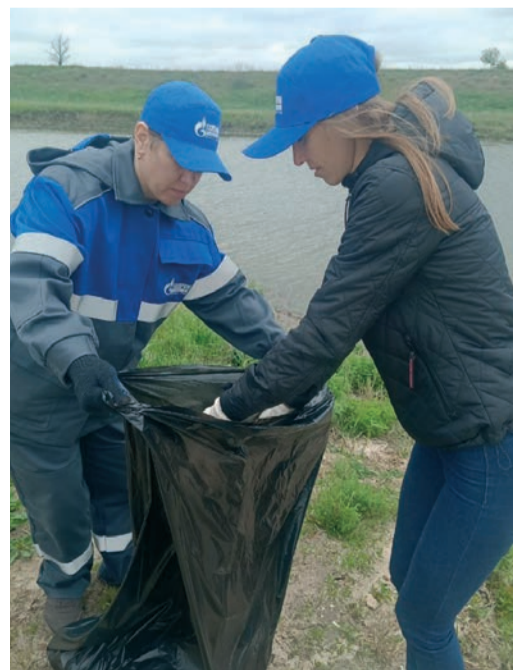
Работники Котельниковского ЛПУМГ расчистили Центральный пляж города Котельниково на реке Аксай-Курмоярский к началу купального сезона