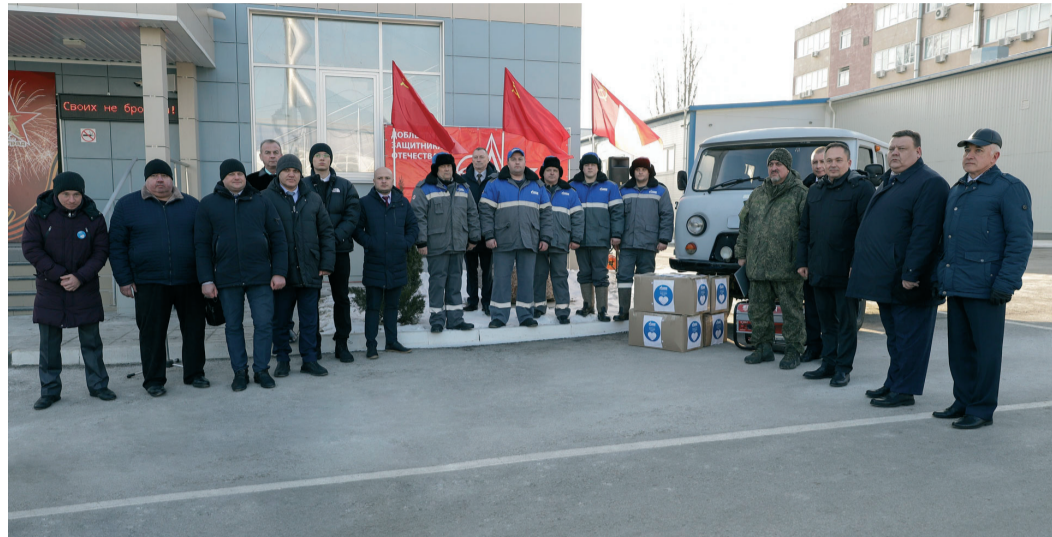
Руководство компании, инициаторы, активисты и участники патриотической акции

Сотрудники ООО «Газпром трансгаз Волгоград» ко Дню защитника Отечества передали автомобиль УАЗ российским военнослужащим, которые выполняют свой долг в ходе специальной военной операции. Транспортное средство активисты компании приобрели на личные средства. Кроме внедорожника, в зону спецоперации передали бензогенератор и посылки с теплыми вещами, которые с заботой и любовью сшили и связали работники Общества, их дети и пенсионеры предприятия.