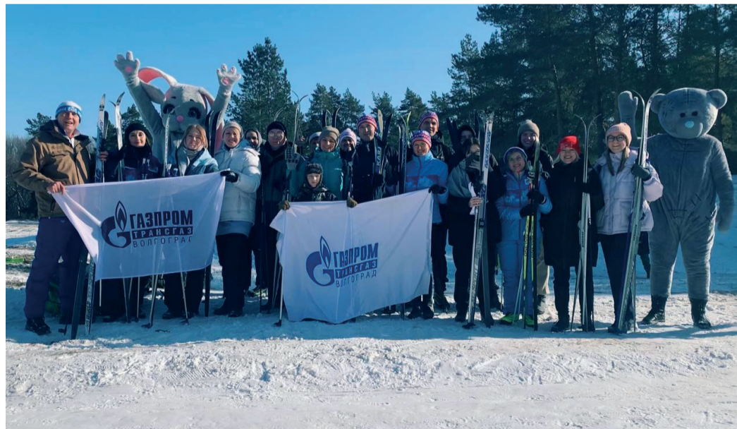
Сборная Общества стала участником «Лыжни России – 2023» во Фроловском районе Волгоградской области

В рамках фестиваля «Лыжня России» сотни тысяч россиян приняли участие в массовом лыжном забеге, ставшем уже традиционным.