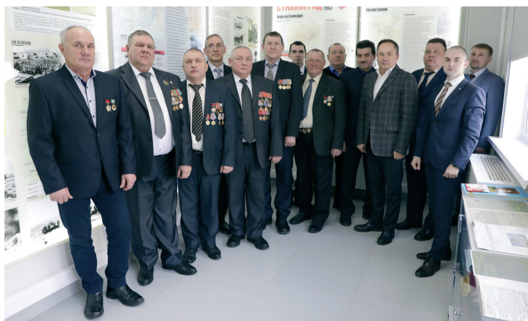
Встреча руководства Общества с работниками предприятия – участниками боевых действий в Афганистане прошла в Центре корпоративной истории

15 февраля в России отмечают памятную дату – День памяти о россиянах, исполнявших служебный долг за пределами Отечества и 34-ю годовщину вывода советских войск из Афганистана. В филиалах ООО «Газпром трансгаз Волгоград» работают 25 воинов-интернационалистов, за плечами которых боевые действия в Афганистане, Сирии, Эфиопии. Сотрудники предприятия присоединились к поздравлениям и праздничным мероприятиям этого дня.