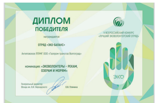
Диплом победителя в номинации «Эковолонтеры – рекам, озерам и морям»