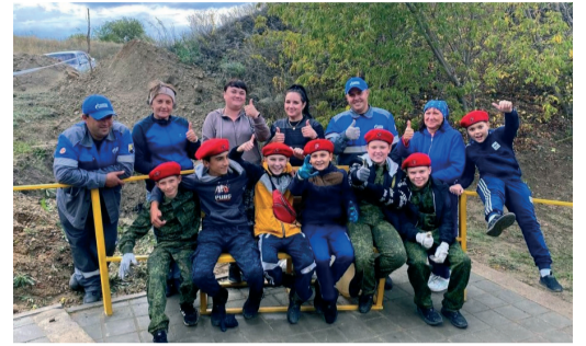
ЭКОЛОГИЧЕСКИЙ ОТРЯД ООО «ГАЗПРОМ ТРАНСГАЗ ВОЛГОГРАД» СТАЛ ПОБЕДИТЕЛЕМ КОНКУРСА ФОНДА ИМЕНИ В.И. ВЕРНАДСКОГО