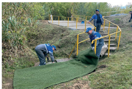
Наши коллеги расчистили и благоустроили родник в родном селе