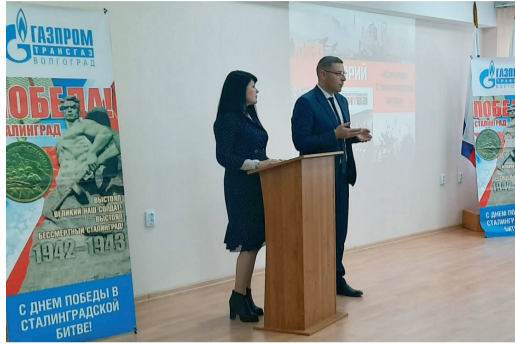
Кинолекторий «Страницы Сталинградской битвы» в Городищенском ЛПУМГ