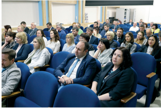
Кинолекторий «Страницы Сталинградской битвы» в администрации Общества