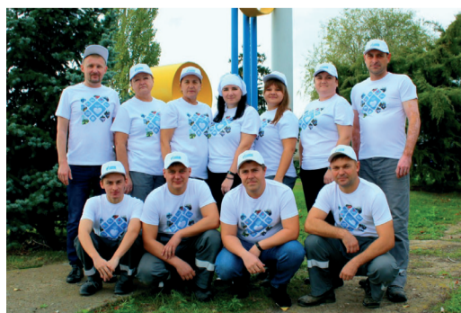
Отряд «Эко-баланс» Антиповского ЛПУМГ ООО «Газпром трансгаз Волгоград»