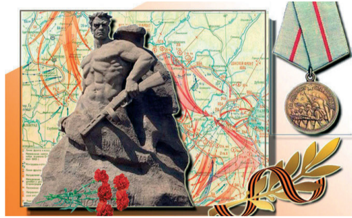
80-Й ГОДОВЩИНЕ ПОБЕДЫ ПОД СТАЛИНГРАДОМ ПОСВЯЩАЕТСЯ