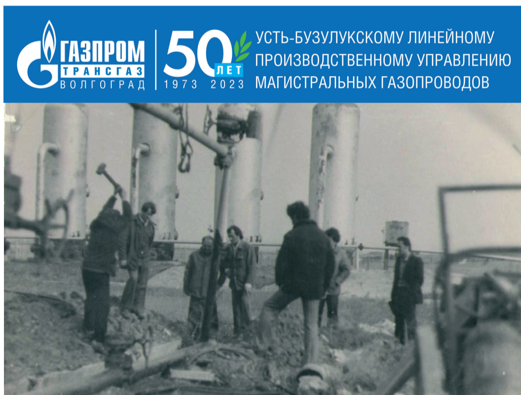
Общий вид строительной площадки пылеуловителей КС «Усть-Бузулукская», 1973 год

5 января в Усть-Бузулукском линейном производственном управлении магистральных газопроводов отметили 50-летний юбилей со дня своего образования.