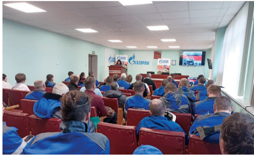
КИНОЛЕКТОРИЙ «СТРАНИЦЫ СТАЛИНГРАДСКОЙ БИТВЫ»