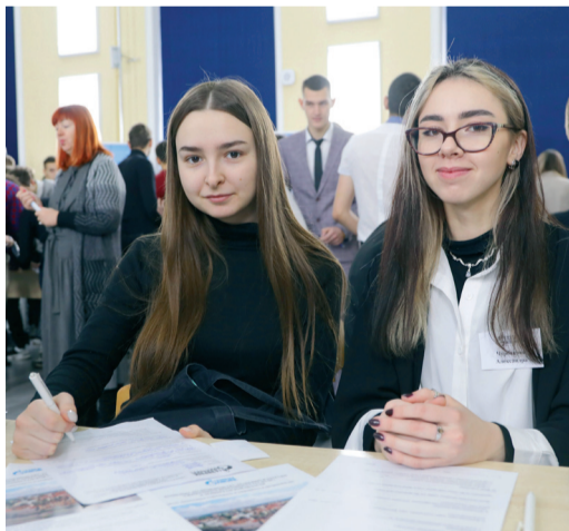
Всего ярмарку и стенд Общества посетили 350 человек

Руководствуясь корпоративными ценностями ПАО «Газпром» сотрудники ООО «Газпром трансгаз Волгоград» 8 декабря приняли участие в традиционном мероприятии, направленном на создание позитивного имиджа Общества – «Ярмарке вакансий» для студентов, которая состоялась в ЧПОУ «Газпром колледж Волгоград».