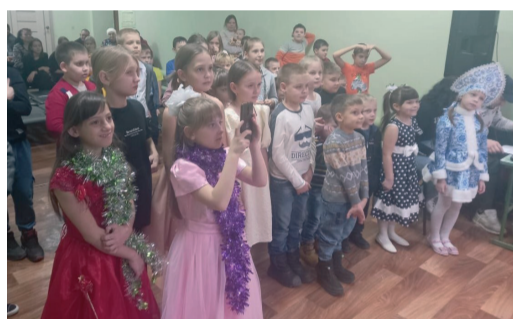
Новогодний праздник в Бубновском СДК подарил детям улыбки и хорошее настроение

В мероприятиях, которые прошли в сельских Домах культуры шести районов Волгоградской области, приняли участие более 600 детей, в том числе дети мобилизованных жителей, которые принимают участие в специальной военной операции.