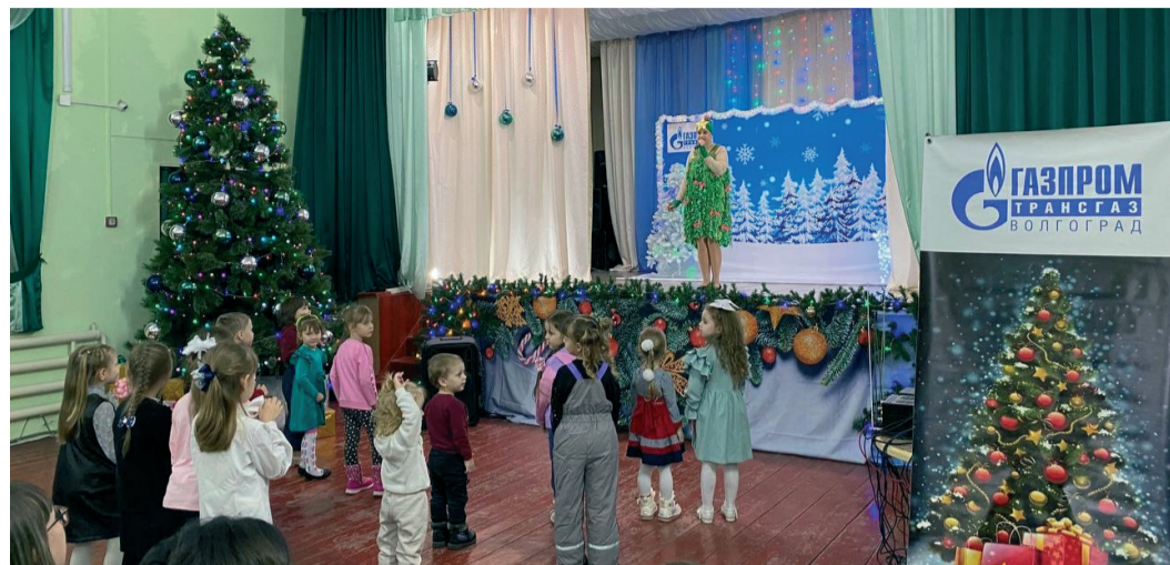
Новогодняя елка при поддержке Общества прошла в сельском Доме культуры Ольховского района

Работники ООО «Газпром трансгаз Волгоград» организовали и провели праздничные представления для детей в канун Нового года. Мероприятия состоялись при поддержке руководства компании и ОППО «Газпром трансгаз Волгоград профсоюз», а также администраций районов.