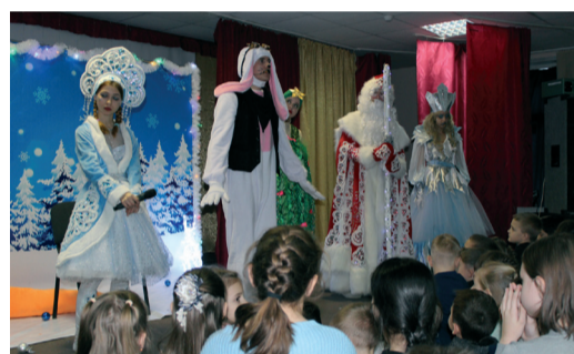
Веселая Новогодняя елка для детей прошла в Антиповском Доме культуры