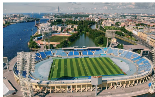
СБОРНАЯ КОМАНДА ОБЩЕСТВА ГОТОВА К УЧАСТИЮ В ЛЕТНЕЙ СПАРТАКИАДЕ ПАО «ГАЗПРОМ» 2022 ГОДА