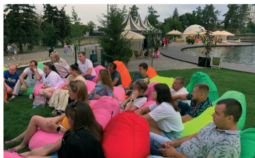
СОВЕТ МОЛОДЫХ УЧЕНЫХ И СПЕЦИАЛИСТОВ ОБЩЕСТВА ПОДВЕЛ ИТОГИ РАБОТЫ