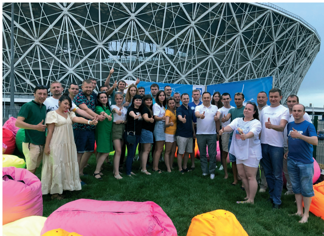
Встреча прошла в непринужденной обстановке и «на позитиве»

В июле Совет молодых ученых и специалистов ООО «Газпром трансгаз Волгоград» подвел итоги своей деятельности за первое полугодие 2022 года и наметил основные задачи на предстоящий период работы.