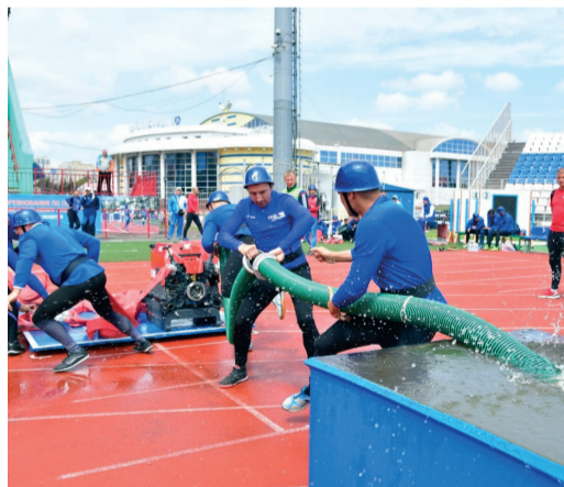
Спортсмены сборной команды «Газпром трансгаз Волгоград» выполняют боевое развертывание от мотопомпы

С 21 по 23 июня сборная команда ООО «Газпром трансгаз Волгоград» приняла участие в соревнованиях по пожарно-спасательному спорту, которые прошли на базе ООО «Газпром трансгаз Нижний Новгород» в городе Саранск (республика Мордовия). В составе сборной команды Общества на соревнованиях выступили работники Бубновского, Антиповского, Калачеевского ЛПУМГ и УАВР.