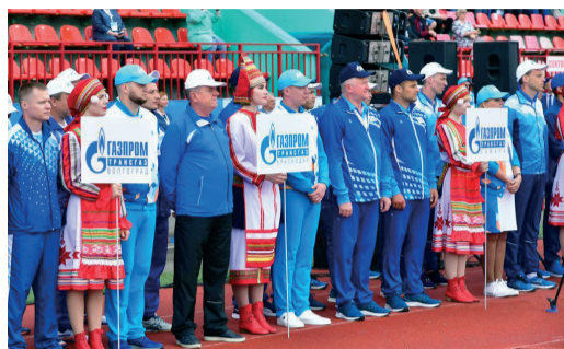
НАШИ В ПЯТЕРКЕ ЛИДЕРОВ В СОРЕВНОВАНИЯХ ПО ПОЖАРНО-СПАСАТЕЛЬНОМУ СПОРТУ ПАО «ГАЗПРОМ»