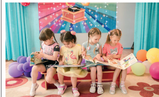
В ООО «ГАЗПРОМ ТРАНСГАЗ ВОЛГОГРАД» ПОДВЕЛИ ИТОГИ ВОЛОНТЕРСКОЙ АКЦИИ «ДОБРЫЕ КНИГИ»