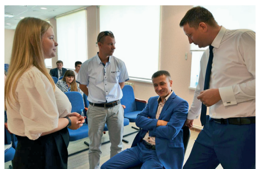
В рамках встречи молодые работники приняли активное участие в обучающих тренингах, деловых и интеллектуальных играх

Ольга КОСТРЫКИНА