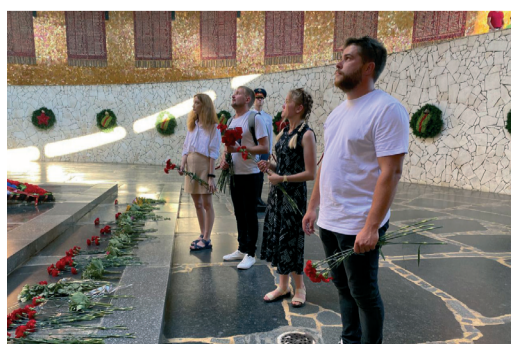
В Волгограде молодые специалисты ООО «Газпром трансгаз Волгоград» посетили главную высоту России Мамаев курган

С ДНЕМ РОЖДЕНИЯ, «ГАЗПРОМ ТРАНСГАЗ ВОЛГОГРАД»!