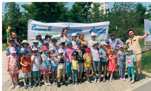
Дети от 2 до 16 лет приняли участие в эко-квесте

4 июня во всех филиалах Общества при поддержке Неправительственного экологического фонда имени В.И. Вернадского состоялся семейный экологический праздник, приуроченный к празднованию Всемирного дня охраны окружающей среды. Участие в мероприятии приняли более 700 работников Общества вместе с семьями.