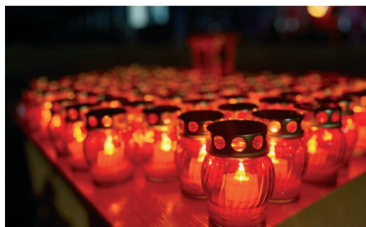
РАБОТНИКИ ОБЩЕСТВА ЗАЖГЛИ 2000 СВЕЧЕЙ В ПАМЯТЬ О ПОГИБШИХ В ВЕЛИКОЙ ОТЕЧЕСТВЕННОЙ ВОЙНЕ