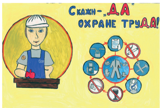
Софья Власенко, «Скажи ДА охране труда!», Антиповское ЛПУМГ