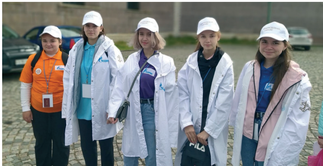
Участниками Петровского пленэра стали дети работников Общества, прошедшие отборочный тур

Дети работников ООО «Газпром трансгаз Волгоград» стали участниками финала уникального инклюзивного проекта ПАО «Газпром» «Петровский пленэр», который состоялся 4 июня в Санкт-Петербурге в рамках празднования 350-летия со дня рождения Петра I.