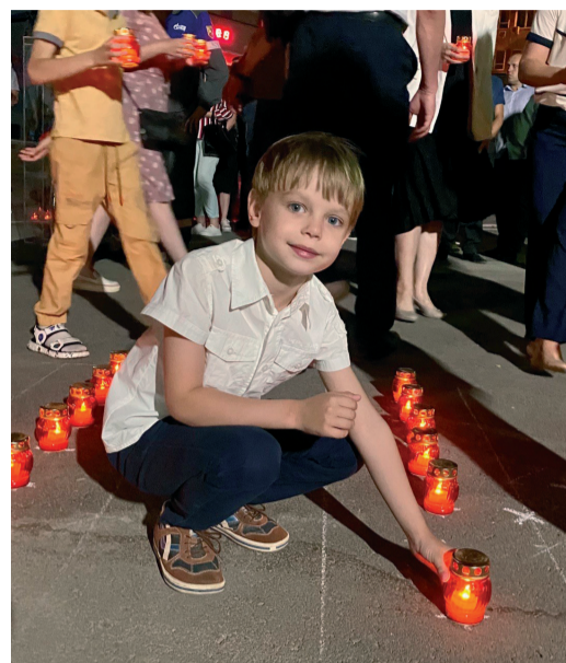
Отдать дань памяти собрались работники Общества и их дети

В ночь с 21 на 22 июня – День начала Великой Отечественной войны – в трех областях России сотрудники «Газпром трансгаз Волгоград» зажгли 2000 поминальных свечей в память о тех погибших, которые первыми приняли удар фашистских захватчиков.