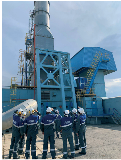
Обсуждение технических деталей работы установки на компрессорной станции Котельниковского ЛПУМГ

В ыбор площадки был обусловлен сразу несколькими параметрами – режимом работы объекта и условиями его эксплуатации (температуры наружного воздуха до 42 градусов), особенностями исходного газоперекачивающего оборудования станции, и возможностью сразу протестировать работу установки в условиях высоких температур окружающего воздуха в летний период (свыше 30 градусов). Использование инновационной установки позволит повысить эффективность работы газоперекачивающих агрегатов и снизить расход газа на собственные технологические нужды.