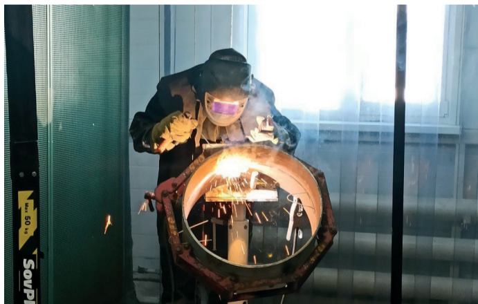
Конкурс «Лучший по профессии» - 2022 – «сварщик»

По результатам всех этапов конкурса работники Общества подтвердили свой высокий уровень профессионализма. Лучшими в профессии «сварщик» среди работников ООО «Газпром трансгаз Волгоград» стали: