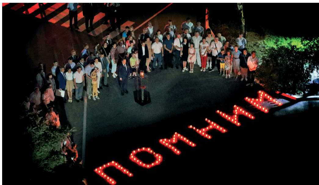
В память о погибших участники мероприятия зажгли свечи, которыми затем выложили слово «Помним»

22 июня – День памяти и скорби. В этот день 81 год назад жизнь почти 200 млн человек разделилась на «до и после» – по всем городам разнеслось тревожное сообщение о нападении вражеских войск на нашу страну. Началась Великая Отечественная война – 1418 дней, полных героизма и мужества. Пока мы помним о ветеранах, их подвиг жив. 22 июня по всему миру зажигаются свечи в ночной тишине в память о всех, кто отдал жизни во имя Великой Победы.