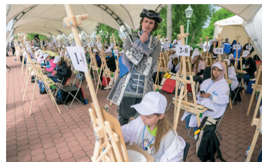
ДЕТИ РАБОТНИКОВ ОБЩЕСТВА СТАЛИ УЧАСТНИКАМИ ИНКЛЮЗИВНОГО ПРОЕКТА ПАО «ГАЗПРОМ» «ПЕТРОВСКИЙ ПЛЕНЭР»