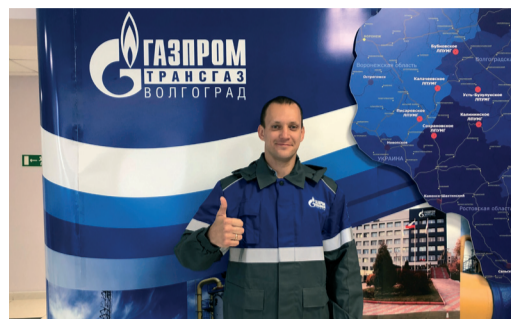
В ООО «ГАЗПРОМ ТРАНСГАЗ ВОЛГОГРАД» ПОДВЕЛИ ИТОГИ КОНКУРСОВ ПО РАЦИОНАЛИЗАТОРСКОЙ ДЕЯТЕЛЬНОСТИ