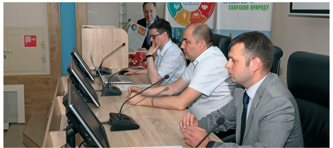
Научно-техническое совещание на базе ООО «Газпром трансгаз Волгоград»