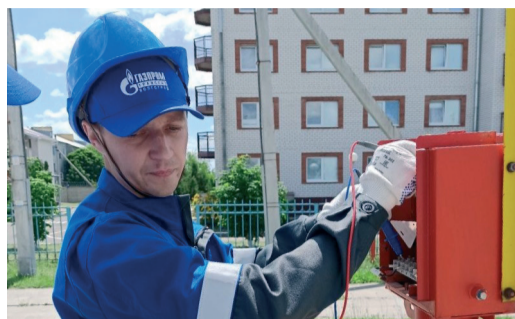
В ООО «ГАЗПРОМ ТРАНСГАЗ ВОЛГОГРАД» ВЫБРАЛИ ЛУЧШИХ ПО ПРОФЕССИИ