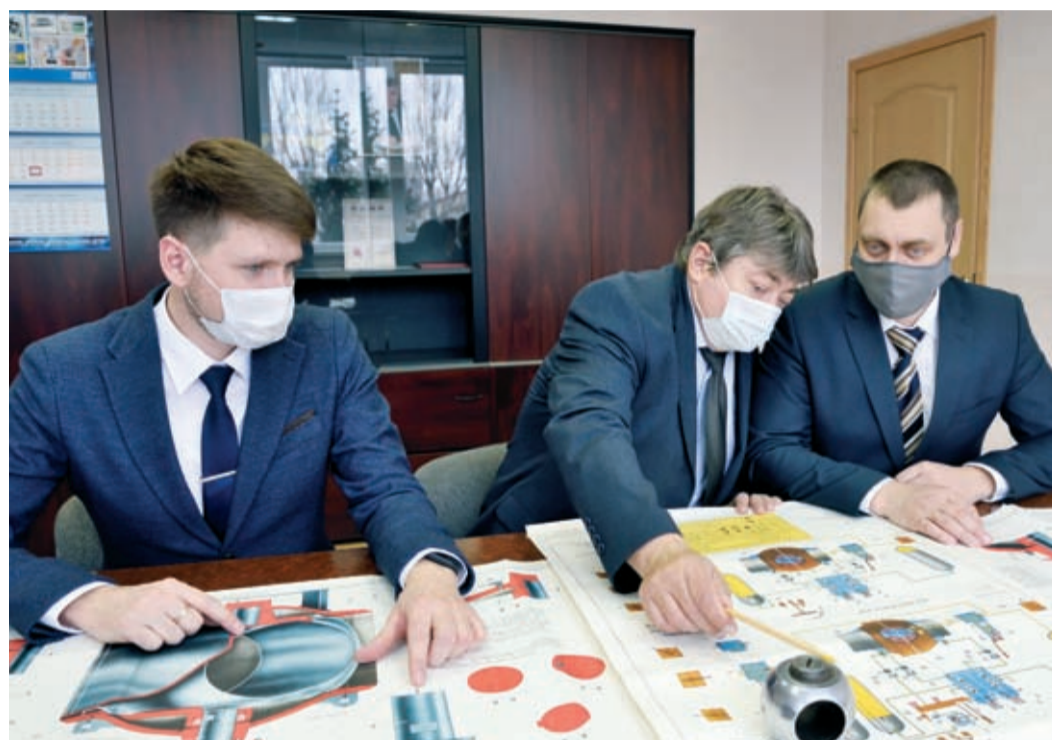
Авторская группа готовит документы для представления на регистрацию патента в Федеральной службе по интеллектуальной собственности