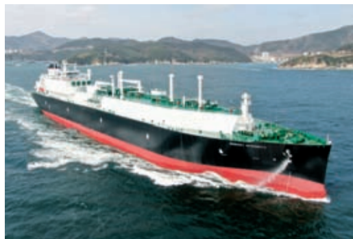
Газовоз сжиженного природного газа Energy Integrity

Работа компании в этом перспективном направлении позволит усилить позиции «Газпрома» на зарубежных рынках и более гибко решать задачи надежного газоснабжения российских потребителей.