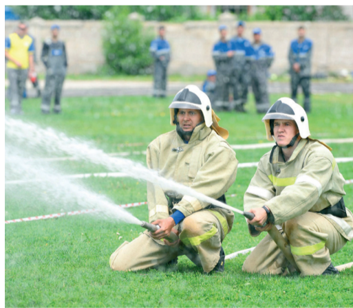
Мишень поражает команда УАВР

Во Фролово состоялся 11-й конкурс профессионального мастерства среди добровольных пожарных команд филиалов ООО «Газпром трансгаз Волгоград». Спустя два года добровольные пожарные Общества вновь соревновались по четырем видам пожарно-спасательного спорта. Цель соревнований — поддержание уровня профессиональной подготовки добровольных пожарных и проверка готовности к ликвидации возможных пожаров. В соревнованиях приняли участие команды, представляющие 17 филиалов Общества. Конкурс прошел при поддержке «Газпром трансгаз Волгоград профсоюз».