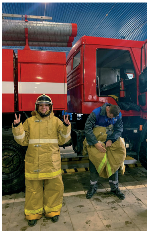
В костюмах пожарных дети работников Сохрановского ЛПУМГ испытали невероятные эмоции

В июне во всех подразделениях Общества прошла акция «К родителям на работу», приуроченная ко Дню защиты детей. В ней приняли участие около 300 детей работников компании. Во всех филиалах Общества были организованы экскурсии на производственные объекты предприятия. Акция прошла при поддержке ОППО «Газпром трансгаз Волгоград профсоюз».