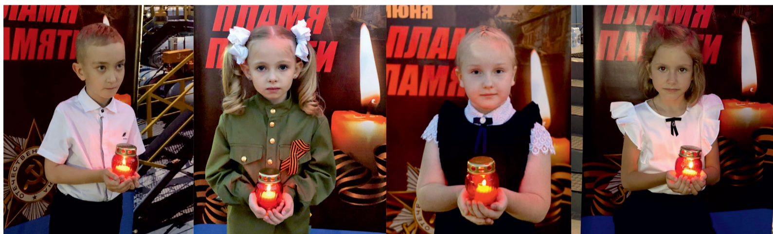
Юные участники акции «Пламя Памяти»