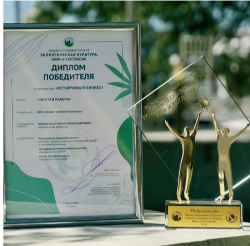
Диплом и награду победителя Международного проекта «Экологическая культура. Мир и согласие» Фонда имени В.И. Вернадского получил проект ООО «Газпром трансгаз Волгоград» «Чистая работа»

5 июня в День эколога и Всемирный день охраны окружающей среды в Москве состоялся «Зелёный фестиваль» Фонда имени В.И. Вернадского. Фестиваль собрал на одной площадке ведущих экологов, представителей бизнеса и власти, общественных деятелей, которые внесли свой вклад в сохранение окружающей среды и в формирование экологической культуры.