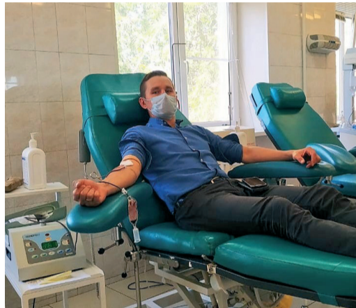
Наши коллеги из ИТЦ ООО «Газпром трансгаз Волгоград» стали донорами и пополнили запасы крови для нуждающихся в Волгоградском областном центре крови