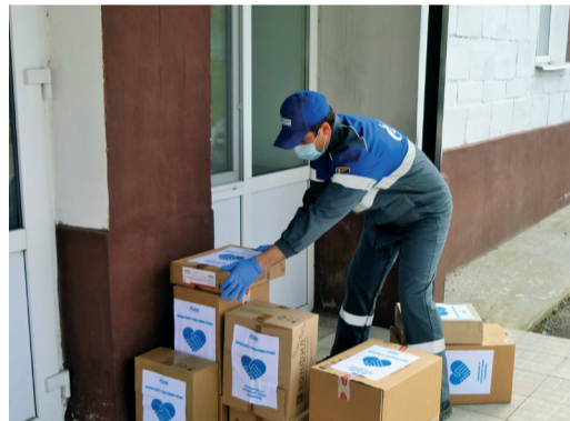
В акции помощи врачам «Почувствуйте тепло наших сердец» приняли участие работники 18 филиалов Общества. На фото: молодые специалисты Бубновского ЛПУМГ передают продуктовые наборы с символом «сердца» врачам Урюпинской центральной районной больницы

Работники Общества посадили «цветы добра» в подшефных детских домах, интернатах, детских садах и других социально значимых объектах. Благодаря активному участию молодых специалистов ООО «Газпром трансгаз Волгоград», розы зацвели на территориях Волгоградской школы-ин-