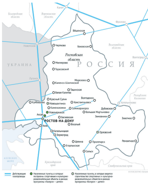
Схема магистральных газопроводов в Ростовской области

19 августа Председатель Правления ПАО «Газпром» Алексей Миллер и Губернатор Ростовской области Василий Голубев подписали программу развития газоснабжения и газификации региона на новый пятилетний период – 2021–2025 годы.