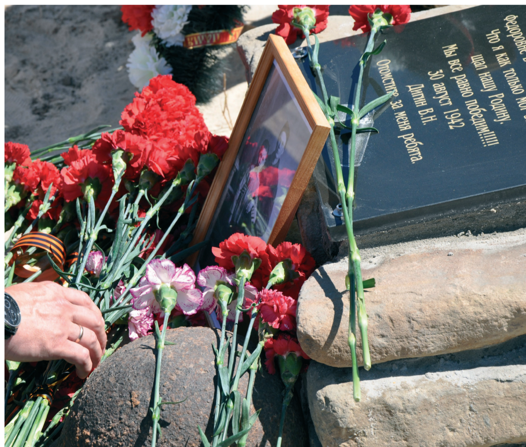
Теперь на месте, где были найдены останки погибших, в селе Орловка установлена мемориальная плита с текстом предсмертной записки