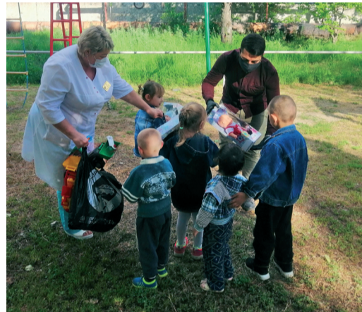
Молодые работники ИТЦ ООО «Газпром трансгаз Волгоград» передали игрушки и средства гигиены детям в ГБУЗ «Волгоградский областной клинический противотуберкулезный диспансер»