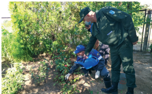
55-ЛЕТИЕ КОМПАНИИ РАБОТНИКИ «ГАЗПРОМ ТРАНСГАЗ ВОЛГОГРАД» ОТМЕТИЛИ ДОБРЫМИ ДЕЛАМИ стр. 1-3

Информационный бюллетень ООО «Газпром трансгаз Волгоград»