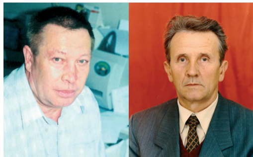
МАРАФОН ПОЗДРАВЛЕНИЙ С 55-ЛЕТИЕМ СО ДНЯ ОБРАЗОВАНИЯ ООО «ГАЗПРОМ ТРАНСГАЗ ВОЛГОГРАД» стр. 4