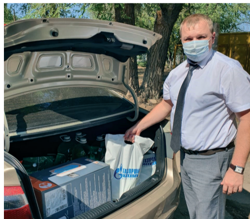
Работники отдела социального развития администрации Общества оказали адресную помощь Волгоградскому областному реабилитационному центру для детей-инвалидов «Доверие»