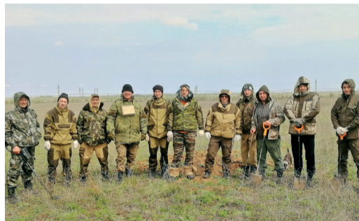
УЧАСТНИКИ ПОИСКОВОГО ОТРЯДА «ГОРЯЧИЙ СНЕГ» УСТАНОВИЛИ ПАМЯТНЫЙ ЗНАК ПОГИБШИМ ЗАЩИТНИКАМ СТАЛИНГРАДА стр. 2-3