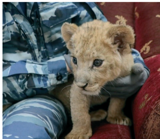
Работники Общества не остались равнодушными к судьбе львенка по кличке Гром и перечислили средства на лечение и операцию