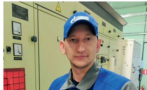
В ООО «ГАЗПРОМ ТРАНСГАЗ ВОЛГОГРАД» ОПРЕДЕЛИЛИ ЛУЧШИХ МОЛОДЫХ РАЦИОНАЛИЗАТОРОВ ЗА 2018-2019 ГОДЫ стр. 4