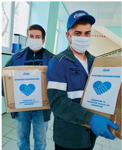
Работники Общества с энтузиазмом откликнулись на инициативу администрации и в кратчайшие сроки собрали средства для оказания помощи врачам