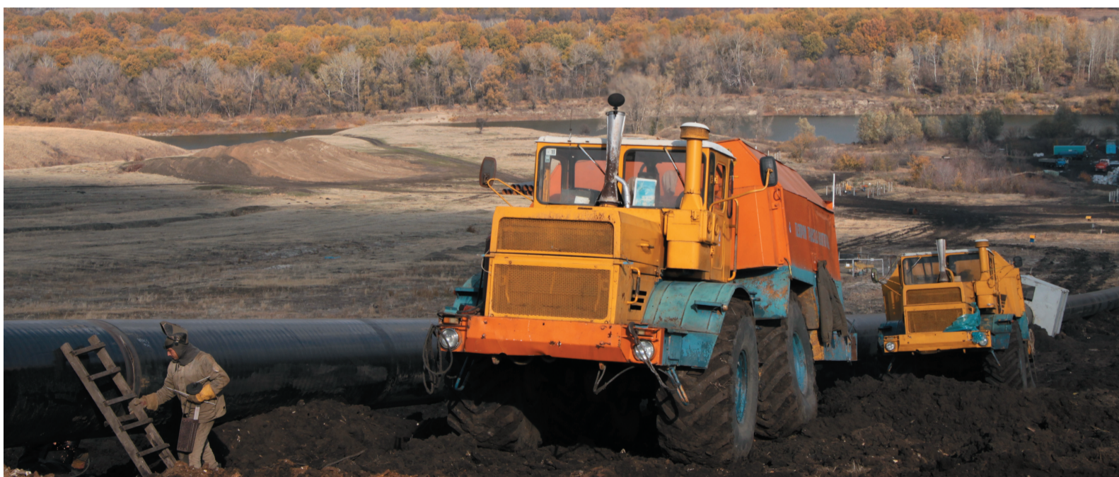
Реконструкция газопровода САЦ-III на переходе через реку Хопер, 2010 год