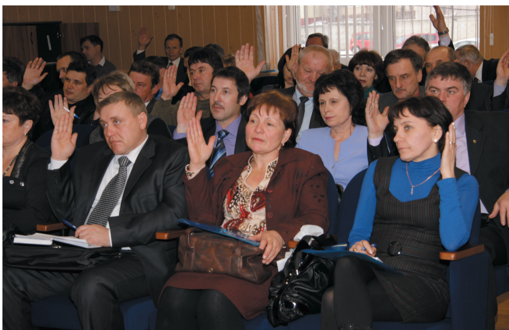
Делегаты конференции голосуют

Другое дело, когда работник предпочитает туристический отдых. Здесь срабатывает возможность получить путевку в пансионат «Магистраль». «Мы заинтересованы в том, чтобы как можно больше наших работников поправили здоровье за время отпуска. Случаи, когда одним все, а другим ничего, необходимо исключить. Все должны быть в равных условиях», - сказал делегатам Кон-