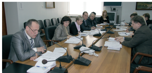
Все филиалы на связи

В конце марта на селекторном совещании молодые специалисты предприятия обсудили план работы на текущий год и подвели итоги года прошлого.