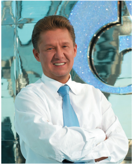
Алексей Миллер, Председатель Правления ОАО «Газпром»

Совет директоров переизбрал Алексея Миллера Председателем Правления ОАО «Газпром» с 31 мая 2011 года сроком на 5 лет.